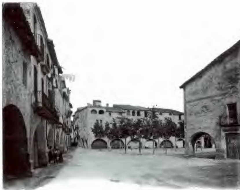
Fig. 2. La plaça Major de Banyoles a principis del segle XX. Durant els actes de l'entrada de l'abat el segle XVIII s'hi feia balls de cavallets i s'hi llançaven salves i morters.

Tord el 12 de juliol d'aquell any, paborde de Sant Pere de Galligants, que actuà com a procurador i germà del nou abat, rebut per les autoritats municipals a l'abadia, i després jurà els privilegis, concòrdies i franqueses de la vila. 48