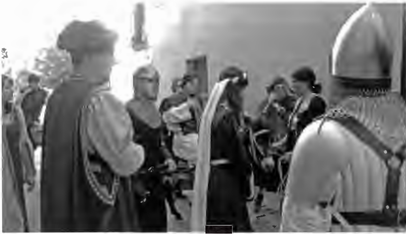
Fig. 5. Recreació del cerimonial d'entrada de l'abat l'any 2011 per la companyia Alma Cubrae, en el lloc de l'antic portal de Girona.

nou abat del monestir benedictí de Sant Esteve de Banyoles, que va créixer en espectacularitat durant els segles del Barroc. Sortosament, s'ha dut a terme la reconstrucció històrica de l'entrada de l'abat l'any 2010 en el marc de la fira medieval i fantàstica Ajoja. Aquesta recuperació ha estat possible gràcies a la col·laboració del Centre d'Estudis Comarcals de Banyoles amb l'Ajuntament de Banyoles. 86