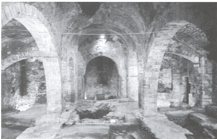
Fig. 3. Interior de l'església finalitzada l'excavació arqueològica.