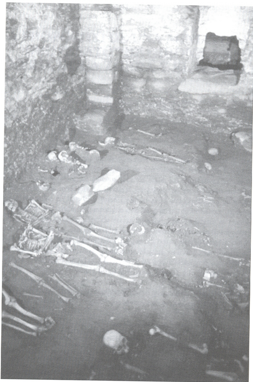
Fig. 4. Sagristia de l'església. Nivell d'inhumacions.