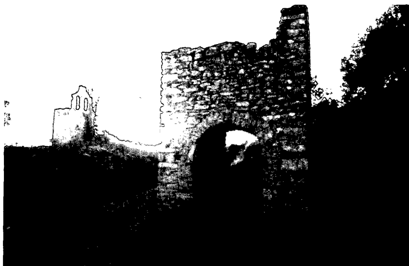
Fig. 1. Vista d'un dels portals amb torre del poble de la Santa Creu de Rodes.