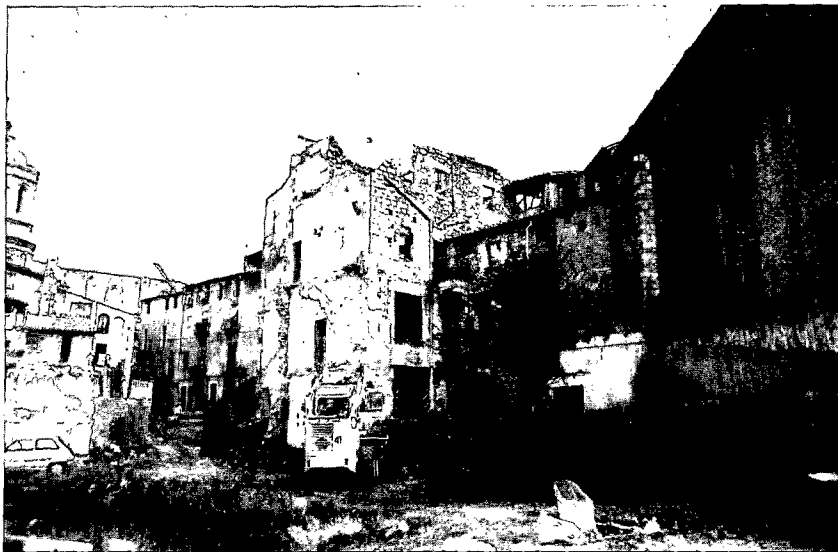
Fig. 1. Vista general de la zona 1 (pati superior) en començar la intervenció arqueològica.