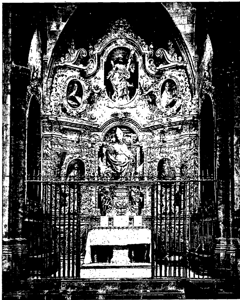
Gerona. Capilla de San Narciso de la Catedral