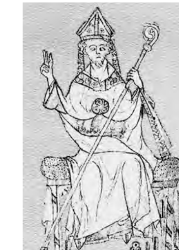
Imatge de Robert de Groneteste primer Chancellor de la Universitat d'Oxford i bisbe de Lincoln (Manuscrit de la Bodleian library d'Oxford).