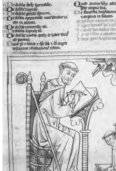
Imatge d'un frare franciscà en les tasques del scriptorium (Manuscrit de la Bodleian library d'Oxford).