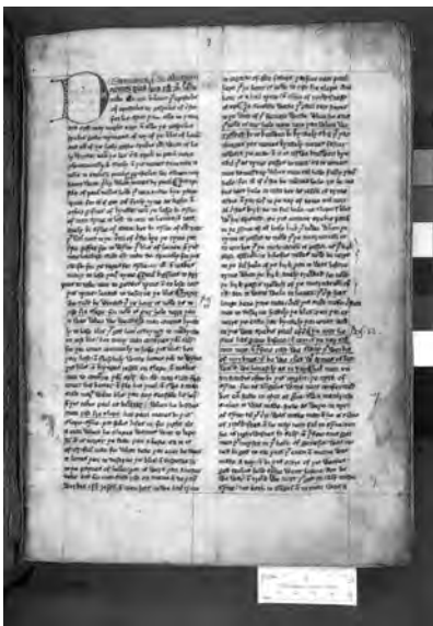
John Wyclif, Sermons on the Sunday Epistles and Gospels. Manuscript s. XIV. Bodleian library, University of Oxford.