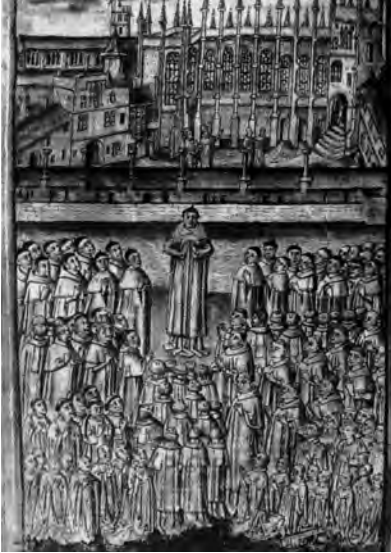
Manuscrit del New College: El guardià "Warden" i els escolars "Scholars", manuscrit de la Bodleian library d'Oxford. S. XIV.