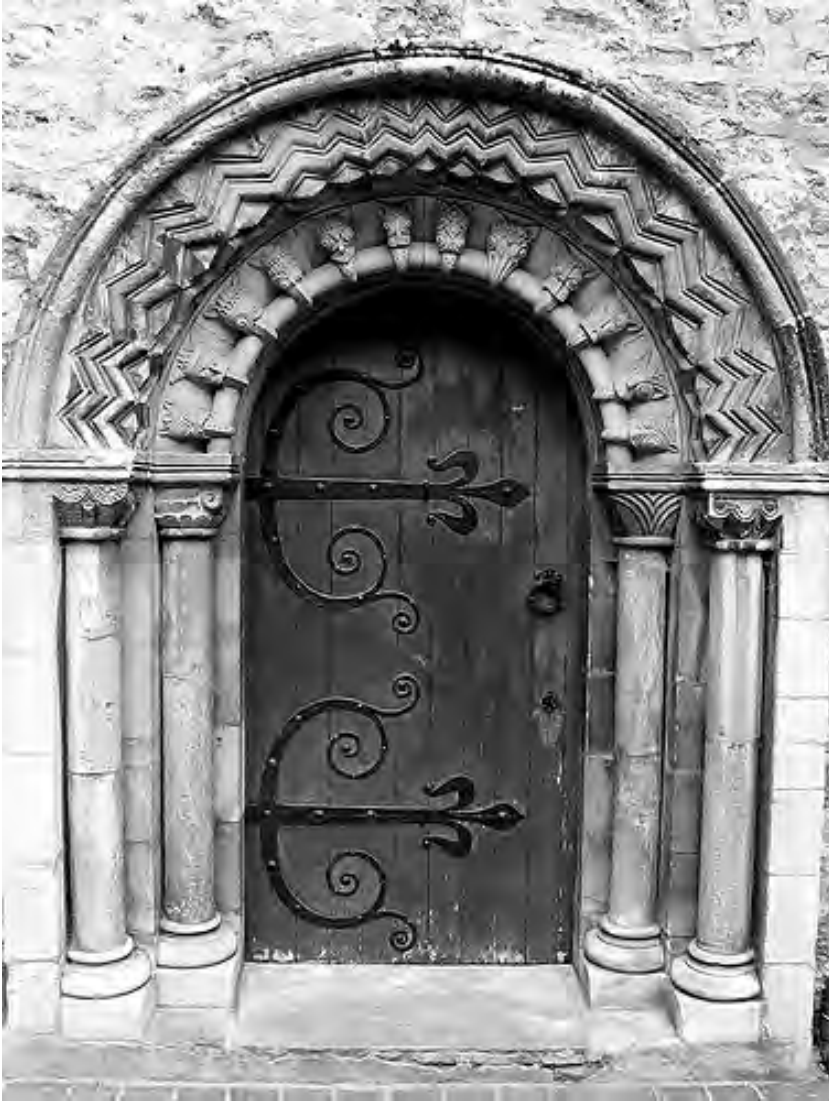
Portalada de l'església de St. Ebbe's, construcció d'època normanda que al segle XIII va ser regentada pels frares franciscans de la comunitat d'Oxford, (reconstruïda al 1816).