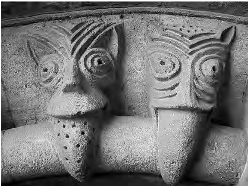
Detalls del pòrtic de l'església de St. Ebbe's d'Oxford.