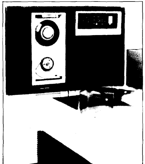
Part de l'equip informàtic de l'Institut Català de Bibliografia.

projecte anomenat CBU (Control bibliogràfic universal) que pretén donar informació sobre tot el que es publica arreu del món. El CBU parteix del principi que el país productor de la informació és el més adequat per recollir-la i registrar-la. Entesa així, la tasca de fer una bibliografia mundial queda repartida entre diferents centres bibliogràfics nacionals que elaboren les notícies bibliogràfiques dels documents produïts en el seu àmbit geogràfic i les difonen a través de les bibliografies nacionals corrents.