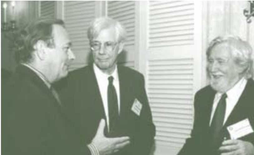
Clifford Geertz (a la dreta) a l'Haskins Lecturer el 1999.

vaig començar a llegir el capítol "The world in pieces: Culture and politics at the end of the century," i al final hi vaig trobar el que necessitava: "sembla que estem condemnats, si més no en el futur immediat i potser bastant més enllà, a viure en el millor dels casos en el que algú, pensant potser en treves iugoslaves, alto-el-focs irlandesos, operacions de rescat africanes, i negociacions en l'Orient mitjà, ha batejat com a pau de baixa intensitat –un ambient en el qual el liberalisme normalment no ha prosperat. Però resulta que és el tipus d'ambient en el qual haurà de funcionar si ha de sobreviure i fer efecte, i mantenir el que a mi em sembla ser el seu compromís més seriós i central: l'obligació moral a l'esperança." (Geertz 2000b:260; traducció meua)