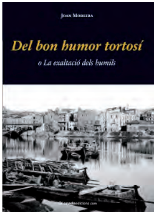
Coberta del llibre Del bon humor tortosí o La exaltació dels humils (2012).