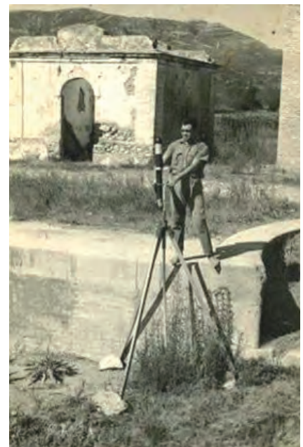
■ Un coeter davant la coetera de l'Esclusa (Amposta), a punt per disparar un coet granífug, l'agost del 1958.

través de la seva Delegación, els podien disparar, i només dins la zona del Delta que tenien assignada, entorn de la seva coetera. Restaven en servei les vint-i-quatre hores del dia, durant tots els dies dels mesos que durava la campanya granífuga, depenent de l'any entre els mesos de juny i octubre. Era prou sacrificat, perquè en qualsevol moment del dia o de la nit podia arribar a la zona una tempesta susceptible d'ocasionar una pedregada, i res (família, treball al camp, oci...) els havia d'impedir acudir a desfer-la, llençant tants coets com calgués.