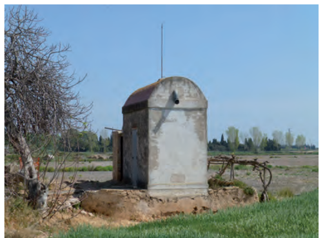
■ Coetera Pinyol (Camarles). Tipus C2. Construïda el 1973.