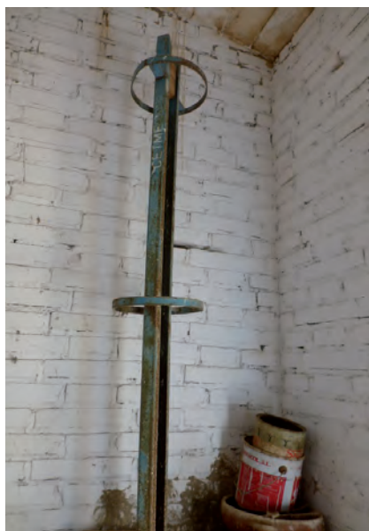
■ Exempler de rampa de llançament dels coets «cota 3000» conservat a la coetera de Pesigo (l'Ampolla).