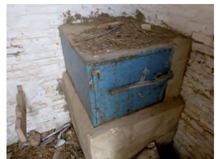
■ Totes les coeteres tenien al seu interior una caixa forta on es guardaven els coets granífugs. Exemplar conservat a la coetera de Pallart (Sant Carles de la Ràpita).