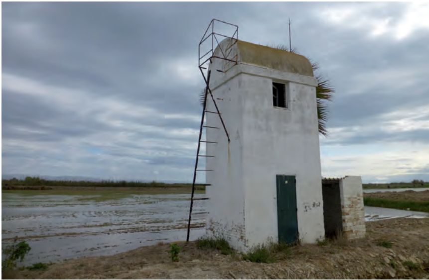
■ Coetera Buda (Sant Jaume d'Enveja). Tipus C3. Edificada el 1951.