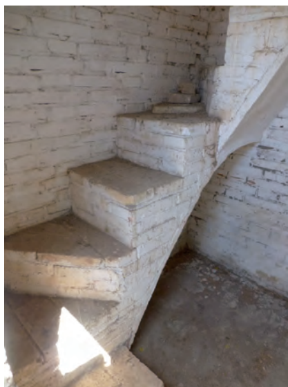
■ Les coeteres tipus C3 eren les úniques que disposaven d'un altell. A la imatge, escales d'accés a l'altell de la coetera Pesigo (l'Ampolla).

La defensa granífiga amb coeteres es va consolidar durant la dècada dels anys seixanta i va tenir continuïtat els anys setanta. Després va iniciar la seva darrera etapa, i va finalitzar cap al 1984. Continuava sent d'interès general, tant per als arrossers com per a les administracions, però el recuperat Govern de la Generalitat de Catalunya en va desestimar la lluita.