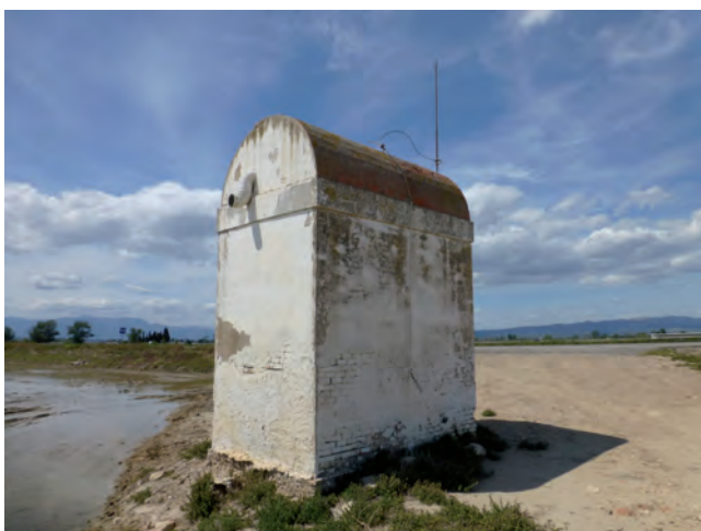
■ Coetera Paredols (Amposta). Tipus C1. Aixecada el 1955.

El Museu de les Terres de l'Ebre disposa, en dipòsit, dels fons documentals de la desapareguda Federació Sindical de Agricultores Arroceros de España