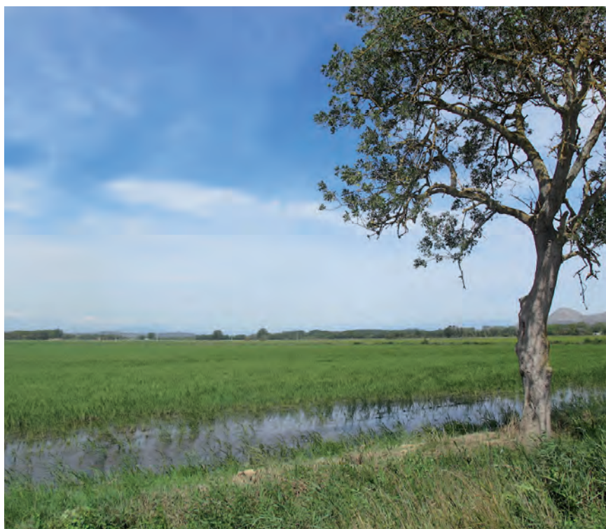
■ Basses d'en Coll, paisatge dels arrossars del marge dret del riu Ter.