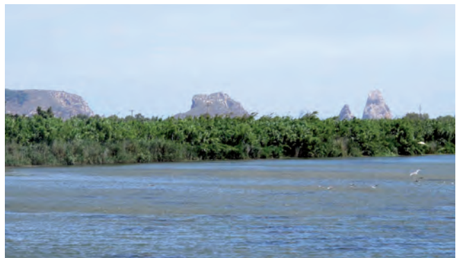
■ Paisatge del Parc Natural del Montgrí, les Illes Medes i el Baix Ter a la zona del marge dret del riu Ter. JUNY DE 2012. LAIA CARDONA