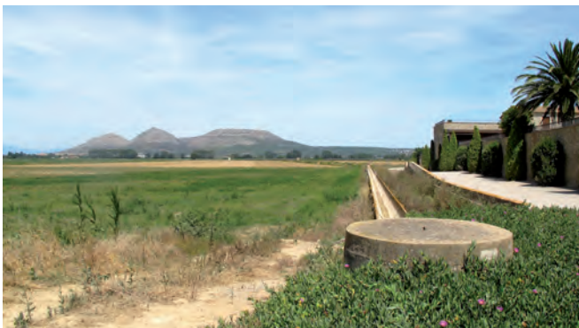
■ Canal de distribució de l'aigua per regar els camps.

Actualment a Pals s'organitzen al llarg de l'any tres jornades de celebració que giren a l'entorn de l'arròs i que representen tres moments importants del procés agrícola d'aquest cultiu. Al juny té lloc la Plantada tradicional, a primers d'octubre la Sega tradicional i entre març i abril les Jornades gastronòmiques de la cuina de l'arròs a Pals, on allò que s'ha produït al camp arriba a la taula, de manera que es tanca el cicle de l'arròs. L'objectiu d'aquestes