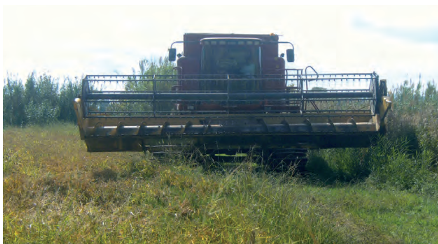
■ Màquina recol·lectora d'arròs. OCTUBRE DE 2012. LAIA CARDONA

La mecanització marcà un abans i un després en la cultura arrossera. El 1952 la família Parera comprà als EUA la primera màquina de segar que separava