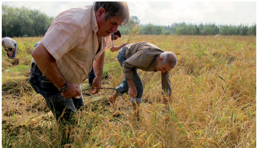
■ Arrossaires reproduint la collita manual de l'arròs a la Festa de la Sega Tradicional.

Les festes de l'arròs constitueixen la patrimonialització d'una forma de vida, la reafirmació de la identitat d'un poble que ha lluitat per l'autosuficiència i l'autarquia, el que Josep Pla denominà «l'esperit de Pals». 9 ■