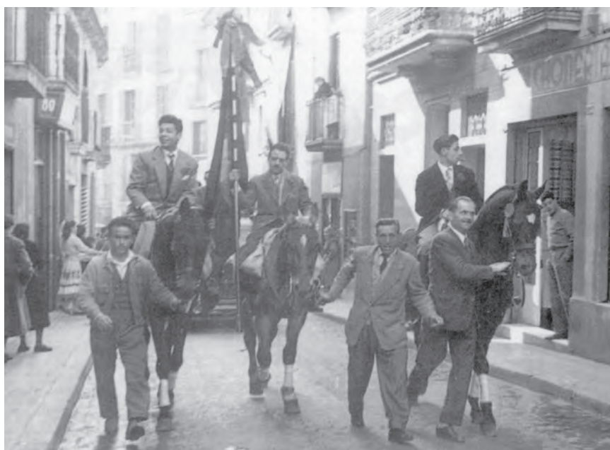
■ La celebració del Tres Tombs encara ocupa un paper destacat en el calendari festiu dels sarrianencs. En aquesta imatge de mitjan anys cinquanta, veiem la corrua pujar pel carrer Major, eix vertebrador de Sarrià, a l'altura de la matalasseria Mota (1956).

Sarrià també té el seu paisatge i el seu territori. Un paisatge que és i ha estat viscut, que és definit socialment i culturalment, i amb el qual els sarrianencs s'identifiquen; que és clau, per tant, en la definició de la comunitat . Aquest paisatge té uns marcadors naturals i humans. Entren en la primera categoria les fonts, les rieres o determinats arbres, indrets on es donaven amb intensitat trobades i relacions: les rieres, com a indret de joc sobretot per a infants i joves; les fonts, com a lloc d'esbarjo i de trobada en una edat més adulta; l'om del Desert, com a símbol amb connotacions religioses.