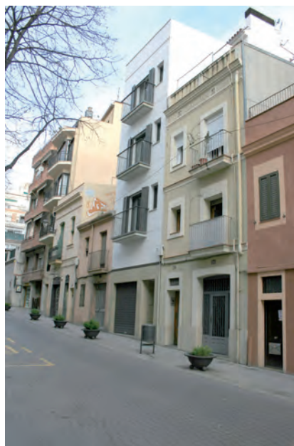
■ Detall de la part inferior del carrer Major, en la qual podem observar diferents tipologies edificatòries que comprenen des de mitjan segle XVIII fins a un any abans de fer-se la fotografia, quan s'edificà el bloc blanc (2012).

l'interior de Catalunya, els aragonesos, els castellans i, més recentment, els europeus i sud-americans; amb els senyors han conviscut els fusters i els paletes; amb els botiguers, els treballadors de les fàbriques; amb els que hi fan vida, els que només hi dormen. De la mateixa manera, hem constatat com en el terreny urbanístic es revelen a Sarrià certes tensions entre àrees diferenciades: entre l'extraradi dels masos i el seus camps, i les cases del nucli i els seus carrerons i places; entre el Sarrià de dalt i el Sarrià de baix; entre el Sarrià «ordenat» i el seu barri Xino ; 9 o entre el nucli i les seves barriades de barraques, com ara la de Can Caralleu. Es tracta de tensions que també es revelen en el camp edificador, especialment palès avui dia davant les diverses tipologies constructives que hi conviuen: masies, cases senyoriales, cases de cós populars, blocs de pisos esgrafats, arrebossats, de maó o de marbre —tot depenent de la moda del moment—, evidència del pas inexorable del temps, però també, com ens destaquen, de la pèrdua d'una fisonomia pròpia.