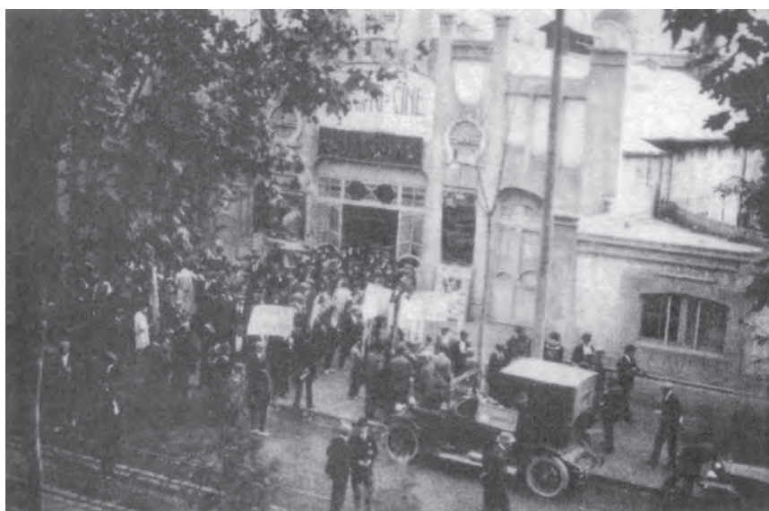
■ Manifestació contra l'agregació davant del cinema Spring el 9 de novembre de 1921 (1921).

esdevingut a dia d'avui negocis de roba o serveis, que sigui més difícil avituallar-se sense sortir de Sarrià que abans, posaria de manifest el procés inexorable d'haver deixat de ser poble . Com amb la resta d'institucions socials, els veïns recorden els trets distintius dels qui regentaven els «colmados» fent servir, per referir-s'hi, en molts casos, malnoms (senyal de rellevància social, sigui en positiu o negatiu), i integrant-los en el quadre dels estatus i les reputacions. En qualsevol cas, s'establien amb molts botiguers relacions que defugien el tracte exclusivament comercial i implicaven també l'esfera personal.