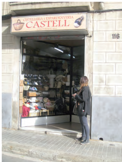
■ Cistelleria Castell al carrer Major de Sarrià, que, amb més de cent cinquanta anys d'història, ocupa, juntament amb la Cistelleria Vila, un paper destacat en l'imaginari col·lectiu de la comunitat en remetre directament a un passat menestral que es resisteix a desaparèixer (2012). MIGUEL DOÑATE SASTRE.

Precisament a Sarrià, a conseqüència del pes de la menestralia, observem com el negoci (la botiga, el taller...) apareix —juntament amb la casa— com a element referencial individual i familiar, i, fins i tot, comunitari. És, sens dubte, una de les principals institucions protagonistes de la quotidianitat sarriana, fins a dia d'avui. Sobretot determinats negocis: els forns i les pastisseries, les ferreteries, les merceries, algunes llibreries, l'estanc, les peixateries, les pensions i els hostals, la lleteria, la castanyera, algunes fàbriques —de fideus, caramels, joguines, gasosa o pells—, la bòbila... I hi destaquen els cellers i els bars, el mercat —amb les seves pageses— i les botigues de queviures («colmados»). D'aquestes, se'n recorda la ubicació exacta, i la seva història (en concret, l'any de tancament d'algunes) serveix per datar èpoques i pensar en les transformacions urbanístiques i socials. En aquest sentit, el fet que moltes hagin