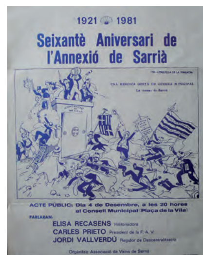
■ Cartell commemoratiu del 60è aniversari de l'annexió de Sarrià. Resulta interessant l'elecció per a l'ocasió d'una vinyeta de l'Esquella de la Torratxa del 1921, en la qual es representa la lluita entre Barcelona i Sarrià (1981).

la casa del Marquès d'Alòs i, per descomptat, l'om centenari). Collserola i el Pla, límits naturals curulls d'indrets, personatges i esdeveniments igualment importants: l'aprovisionament a Rubí o Sant Cugat i les rutes de l'estraperlo durant la postguerra; l'esbarjo des de sempre al Tibidabo, a Vallvidrera i el seu pantà, etc.