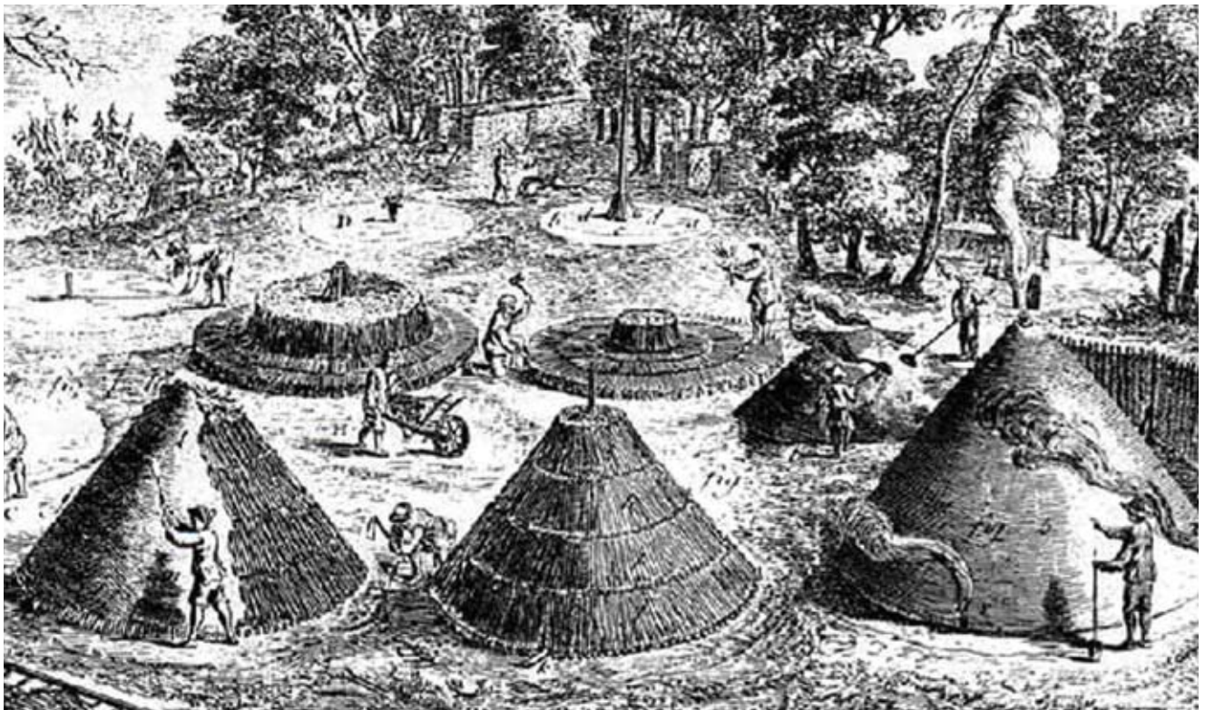
■ FIGURA 1. Tècnica de construcció d'una carbonera francesa (extret de Duhamel du Monceau, 1761).

industrial (fargues), demanava una pujada ràpida de temperatura i un gran poder calorífic, i el pi era l'arbre que tenia aquestes dues qualitats. Per fer carbó per a restaurants o per a llars domèstiques, es demanava un carbó que proporcionés una combustió més lenta i, per tant, més duradora; la millor espècie per obtenir aquest tipus de combustió era l'alzina, espècie que, a més, és molt freqüent a Catalunya. Aquesta és l'espècie que més s'utilitzava a Horta de Sant Joan i a la majoria de poblacions catalanes que venien carbó per a usos diferents de la metal·lúrgia. També utilitzaven, però, altres espècies que estiguessin disponibles en l'entorn que explotaven, si la llenya que oferien aquestes espècies també era bona, barrejant carbó d'alzina amb aquestes espècies. La taula 1 mostra les diferents espècies utilitzades, a part de l'alzina, als diferents llocs de Catalunya (Euba, 2008).