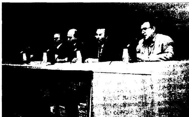
Inauguració de les Jornades

En efecte, després de les Primeres Jornades de Molinologia, fetes a Santiago de Compostel·la l'any 1995, el 1998, el Museu de la Ciència i de la Tècnica de Catalunya i la Fundació Pública Institut d'Estudis Ilerdencs de la Dipu-