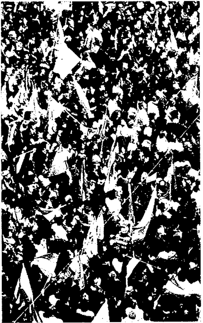
Taula 4. Bascos empadronats a Catalunya (Generacions. Percentatge sobre la població nascuda a la resta de l'Estat).

Al llarg del segle XX, els andalusos han augmentat progressivament la seva presència a Catalunya i principalment a Barcelona. Celebració del Dia d'Andalusia a Barcelona a finals de la dècada dels setanta