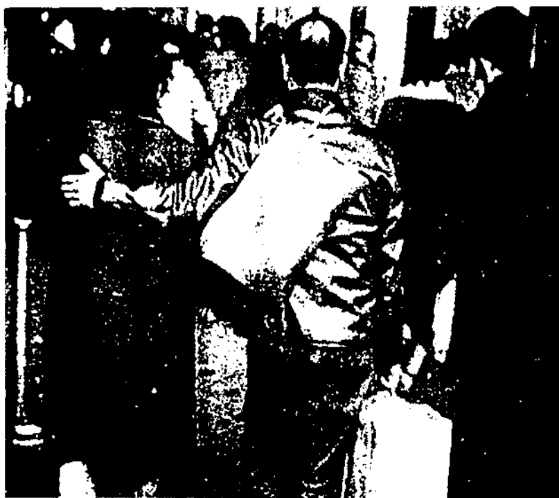
Barcelona s'ha convertit, especialment durant el segle XX, en una ciutat atractiva per a les migracions. Arribada d'immigrants a Barcelona en els anys seixanta

bre més gran d'immigrants a la ciutat' (cf. taula 1).