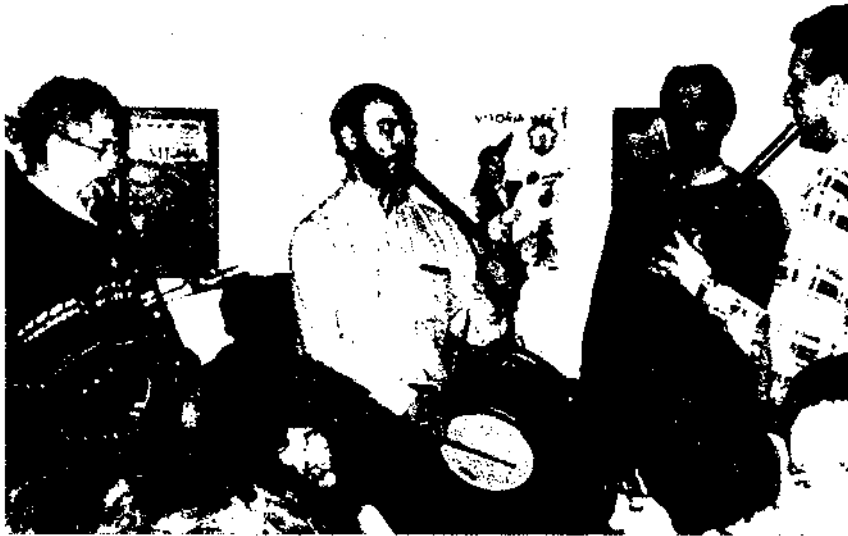
Els grups immigrants porten una apropiació específica de la ciutat que implica una construcció particular de l'espai. Sopar social amb txistularis a l'Euskal Etxea (casa basca) de Barcelona.

nuevas. [...] Yo en un principio me lo pensé un poco, porque, bueno, dejar a mis padres y eso, y marcharme sola a Barcelona, pues no es que me hiciera mucha gracia; pero, bueno, como me interesaba seguir en el trabajo y eso, y sólo iban a ser unos meses, pues me vine. Y ahora ya llevo aquí más de diez años, y no creo que vuelva a casa aún en tiempo (...)" (Dona, alavesa, 32 anys).