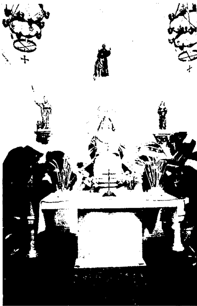
Els individus i els col·lectius immigrants aporten a les societats que els reben els seus bagatges culturals, al temps que reproduïxen i recreen les seves identitats grupals. Capella de la Verge de Guadalupe. Parròquia de la Concepció (Barcelona)

huyendo de Franco, pues vinimos desde Eibar a Bilbao, de Bilbao a Santander, y de Santander a Avilés. Después, desde allí, nos fuimos por mar hasta Burdeos, y de Burdeos volvimos a pasar la frontera hasta aquí (Barcelona)" (Home, guipuscoà, 68 anys).