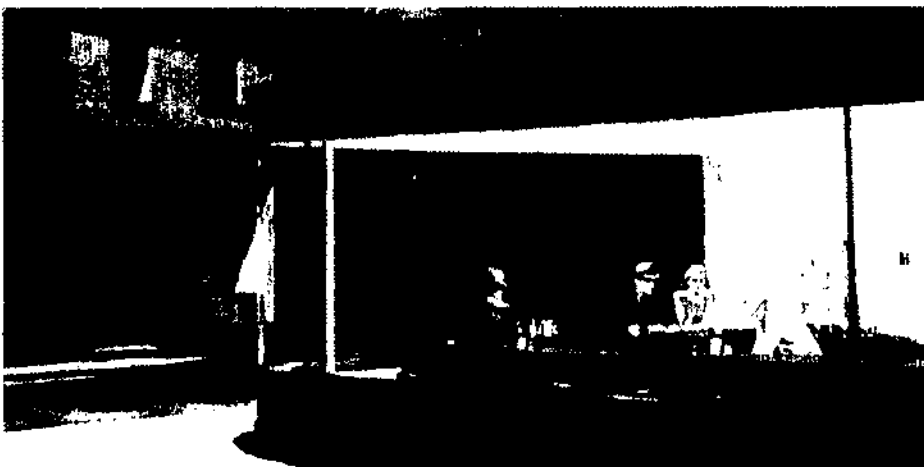
Un «lloc» és un espai urbà on es pot llegir quelcom sobre les identitats individuals i col·lectives, les relacions entre els uns i els altres i la història a la qual pertanyen. Edward Hopper Falcons de la nit (1942)

Resta que, entorn de les viles, és on es multipliquen els espais on el sentit social sembla més problemàtic, sens dubte perquè es defineixen pel doble moviment centrípet i centrífug que jo evocava al començament i que són el punt de partida i final dels fluxos materials i immaterials, humans i no humans, la intensitat del qual caracteritza la nostra supermodernitat.