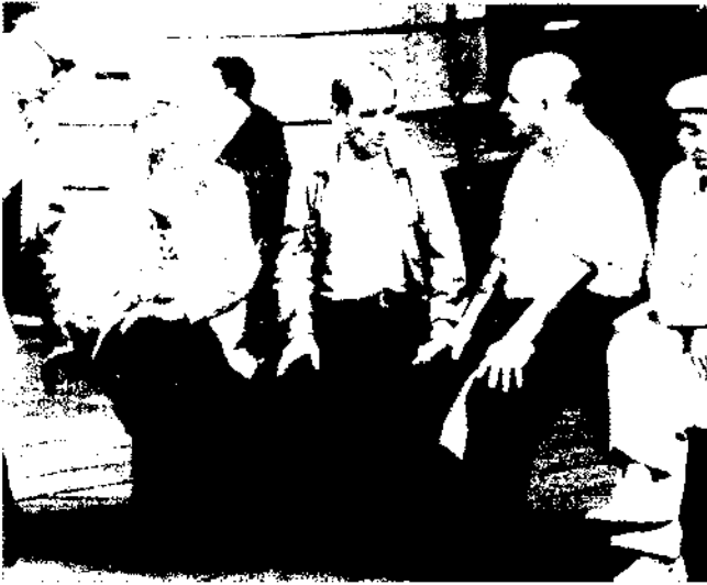
La potencialitat de la ciutat rau en el fet de ser un lloc de trobada, de posada en relació. La Rambla (Barcelona).

res o comercials que reproduïxen poc o molt el mateix decorat, destil·len el mateix tipus de música a les seves seccions o dins els seus ascensors, difonen els mateixos vídeos i proposen els mateixos productes fàcilment identificables d'un extrem a l'altre de la terra. En el fons, les bombolles d'immanència són l'equivalent en ficció de les cosmologies: