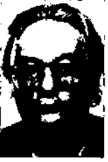
Marc Augé École des Hautes Études en Sciences Sociales. París

A la ciutat contemporània es mesclen les formes de la vida moderna segons els criteris del segle XIX i els de la ciutat actual. Aquesta barreja de formes es pot aprehendre a partir de tres dimensions antropològiques: la memòria, la trobada i la ficció; aquesta última complica les coses en la mesura que subverteix i erosiona les dues primeres.