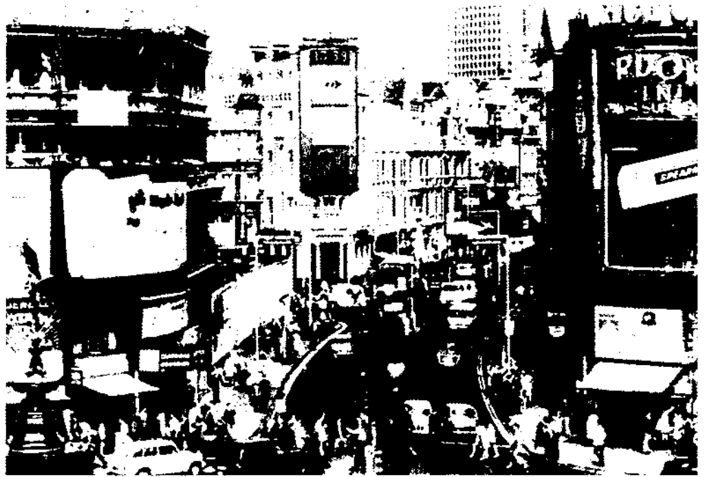
La força mediàtica actual pot comportar que certs espais, urbans o no, siguin en realitat llocs on la ficció sigui l'element determinant. Centre de Londres

tellejant de la ciutat. Penso d'antuvi en el Fòrum de les Halles i en els Camps Elisis.