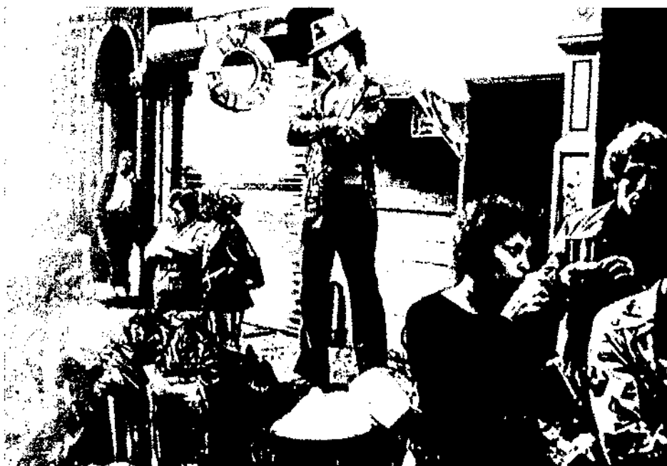
Els suburbis i les perifèries urbanes tenen necessitat d'una major atenció social, econòmica i cívica per tal de tornar-los a posar en els circuits de la vida urbana. Nova York

La ficció emprèn la remodelació, segons els seus criteris, de les formes de la ciutat. La premsa ha assenyalat, fa alguns mesos, que Disney Corporation (com a promotor) havia guanyat un concurs organitzat per l'Ajuntament i l'Estat de New York per edificar un hotel i un centre comercial i de lleure a Time Square i per a la restauració de l'hotel quasi centenari: New Amsterdam, al carrer 42 de Manhattan. Disney Corporation semblava igualment que s'havia d'encarregar de desenvolupar un programa de lleure al Central Park i de crear uns grans magatzems on es podrien trobar tots els subproductes dels seus films al 711 de la 5a Avinguda. Són, doncs, els dos arquitectes de Disney els que han guanyat aquest concurs. I el més remarcable dins d'a-