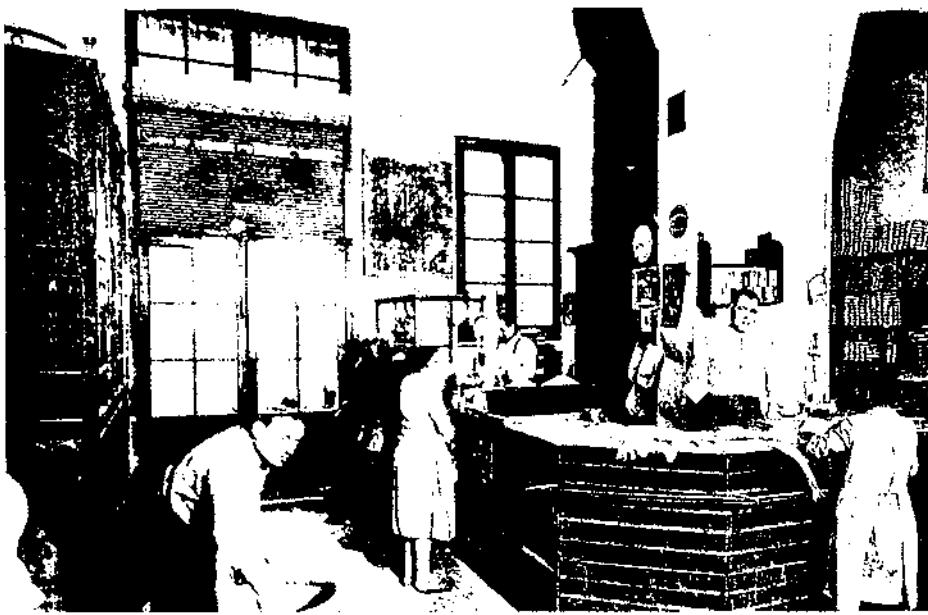
Les cooperatives de consum foren un dels instruments més adients per afrontar les noves necessitats sorgides arran del desenvolupament del país. Cooperativa Agrícola de Valls.

També se'n podia convocar una d'extraordinària sempre que ho demanés la Junta Directiva o 2/3 parts dels socis fundadors (art. 32 i 33).