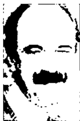
Michel Wieviorka École des Hautes Études en Sciences Sociales CNRS, Paris

La idea de nació s'ha relacionat massa sovint amb ideologies antimodernes, violentes o d'homogeneïtzació; però sota el paraigua del nacionalisme s'encaixen fenòmens i ideologies realment diferents com poden ser el nacionalpopulisme de dretes radicals; l'independentisme, hereu en molts casos dels moviments d'alliberament nacional i social dels anys seixanta-setanta; moviments infrapolítics com els skinheads o, en darrer terme, els estatalsmes basats en una essencialització que pot contribuir a situacions violentes —com fou el cas de l'antiga Iugoslàvia. Cal fer avaluacions analítiques i històriques per a unes millors comprensions.