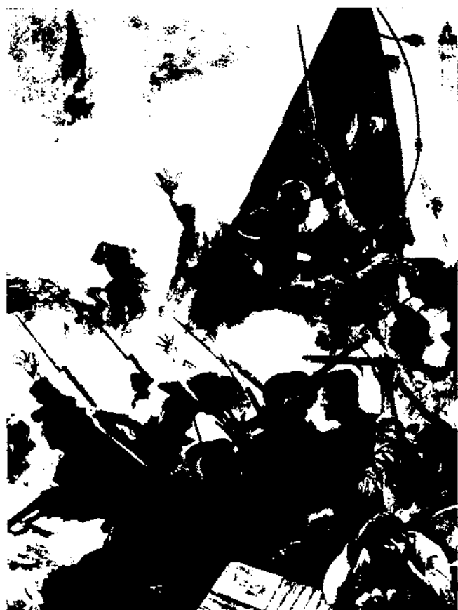
Tot moviment nacionalista necessita diversos tipus de referents, ja siguin històrics, territorials o simplement emocionals, que apel·len als sentiments dels individus, tot vinculant-los a un territori específic, a un passat i a un projecte de futur comuns. Fotografia: detall de L'onze de setembre, obra d'Antoni Estruch.

ment per les raons culturals i històriques que acabem d'esmentar, sinó perquè el territori és el 'continent' de la nació. El territori ens proveeix d'aliments, és on construïm les nostres cases, creem els nostres pobles i ciutats. El territori ens uneix als nostres avantpassats que hi van néixer, viure, treballar, lluitar i morir, i és precisament en aquest sentit, que el territori evoca la continuïtat de la nació i n'esdevé baluard sagrat.