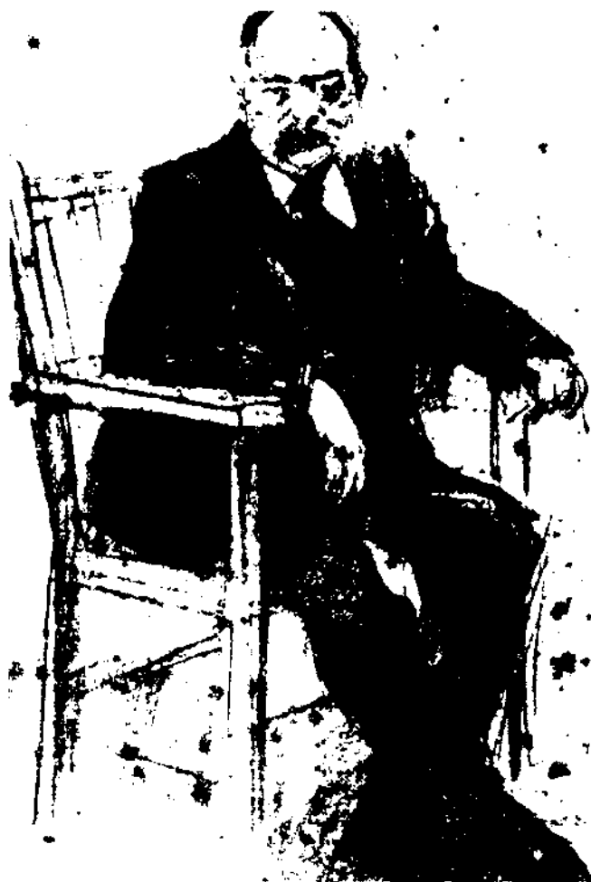
L'aparició d'un moviment nacionalista en una nació sense estat requereix l'existència d'intel·lectuals preparats per construir un discurs nacionalista diferent, i sovint oposat al de l'estat. Fotografia: retrat de Valentí Almirall.

L'existència d'una comunitat que es consideri a si mateixa una nació diferent de la que l'estat pretén promoure té la capacitat d'amenaçar i qüestionar la legitimitat de l'estat, sempre que aquest es defineixi com una institució política unitària. Els estats democràtics reconeixen la diversitat existent a l'interior de les seves fronteres, però solen ser refractaris a utilitzar el terme "nació" quan es refereixen a les minories nacionals que inclouen, atès que les conseqüències polítiques que això pot comportar —per exemple, el reconeixement del dret a l'autodeterminació d'una nació— normalment són molt problemàtiques des del punt de vista de l'estat. Per aquesta raó, l'estat sol tenir per perillosos els nacionalismes regionals, perifèrics o de les minories (la terminologia varia en cada cas) o si més no, els acostuma a percebre com un fenomen molest i gens agradable de tractar.