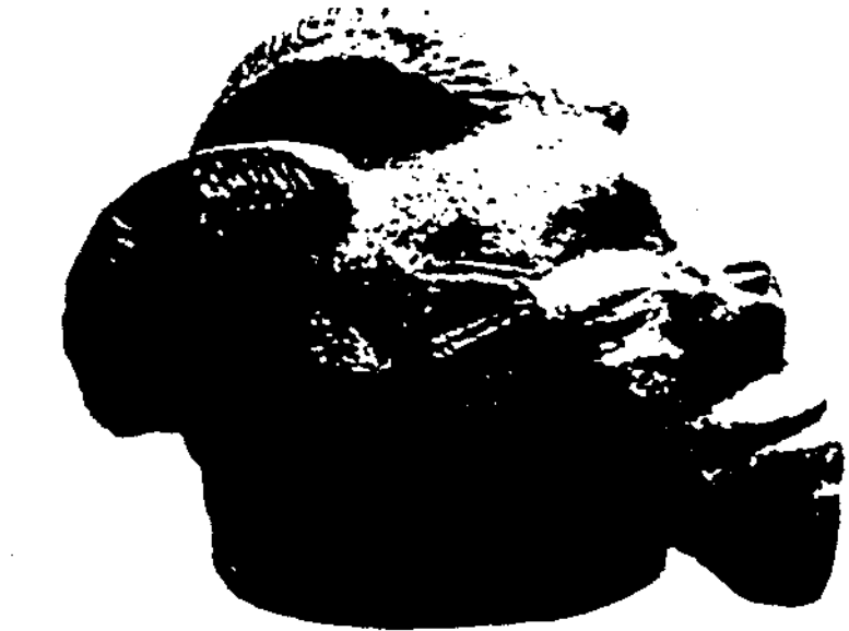
Cap de terracota tiv, anomenat atsuku, en el qual podia habitar un esperit

Això que assenyalarem es pot observar amb claredat en les polítiques colonials europees aplicades a les societats africanes i a les d'altres continents. D'altra banda, les autoritats colonials es van saber beneficiar dels missioners quan van comprovar que els seus interessos coincidien, ja que per imposar el domini públic i social necessitaven una estratègia que no s'acontentés només amb la creació d'una nova ad-