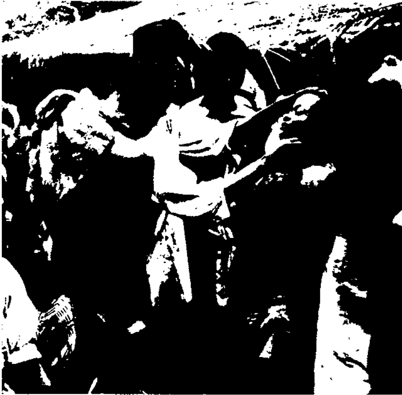
Un dels aspectes que més es va voler combatre per part dels missioners fou tot allò referit als ritus, de qualsevol mena, signe evident de les creences errònies de molts pobles africans. Fotografia: ritu de sanació.

La possibilitat de canviar el matrimoni per intercanvi per un altre que es basés en el "preu de la núvia" va suscitar un agre debat entre els oficials britànics, entre els partidaris i els contraris de la modificació, aquests últims, encapçalats pel prestigiós oficial antropòleg C. K. Meek. No tenim espai per presentar aquesta discussió en detall, però assenyalarem que al final es va imposar l'opció "dura" de Palmer i Feasey.