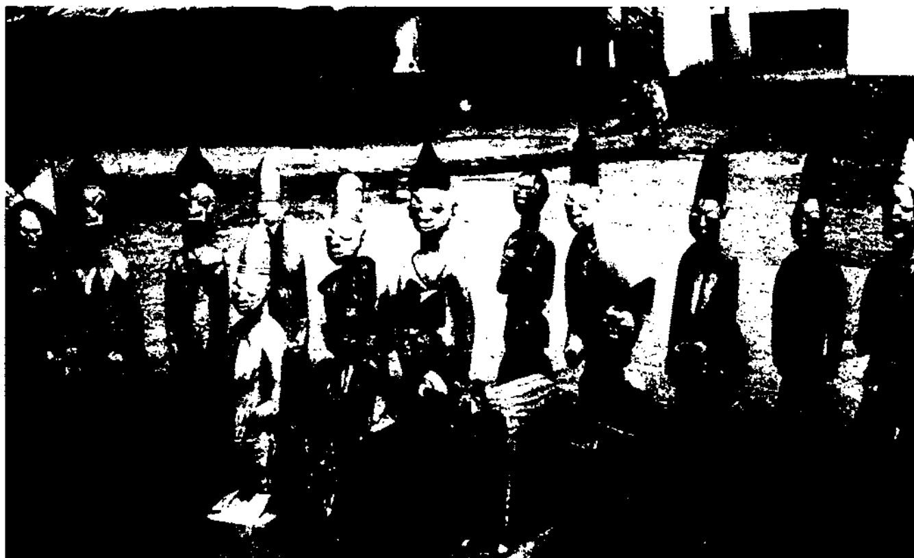
Estatuetes de fusta del santuari dedicat al déu del yoruba Shango a Ede (Nigèria): rei del llamp i dels ferrers.

dones i dels joves que estan sota el control o dependència dels caps de família". 9 Un dels missioners, que posteriorment va ser el president de la DRCM, assenyalava, efectivament, que "la dona i els seus drets no semblen fonamentals: el seu desenvolupament, la seva esfera d'influència, la seva feina, la seva emancipació". 10