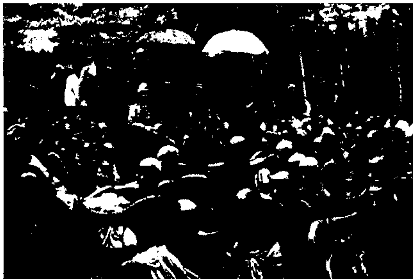
El domini polític anglès sobre la zona del tiv (actual Nigèria aproximadament) fou un element de primer ordre per introduir les practiques occidentals. Fotografia: el capità G. C. Denton, secretari colonial de Lagos, rep de mans del rei Ado la sobirania del territori controlat per l'Imperi Britànic des del 1891 a l'actual Nigèria.