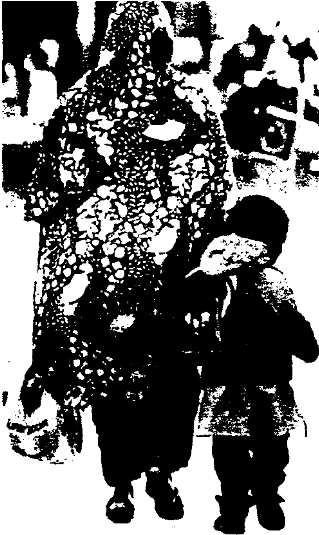
L'arribada de nous col·lectius d'immigrants a Catalunya en els darrers anys del segle xx ha fet evident la importància de les actuacions conjuntes de totes les institucions. Fotografia: mare i nen d'origen subsaharià a Girona.

ment escoltats en aquells aspectes que es referien al tractament de la diferència cultural, mentre que pel que fa als factors estructurals o a les dimensions socials, compartien l'autoritat amb professionals d'altres disciplines. Es va manifestar també molt clarament que les categories analítiques no són neutres políticament i aparegueren problemes amb l'ús de determinats conceptes que, en canvi, estaven ben definits i assumits per la comunitat científica. 7 Cal dir que es va fer un gran esforç, i que tothom va tenir molta paciència i generositat per poder arribar a tenir un únic document de consens que, lògicament, expressava només principis molt generals respecte a les polítiques d'immigració. 8 Les diferències ideològiques tindrien oportunitat d'expressar-se posteriorment en l'a-