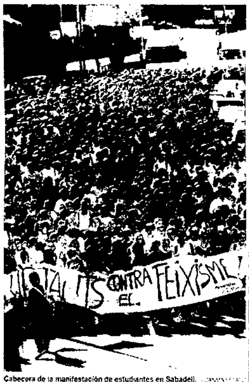
Cabeceira de la manifestación de estudiantes en Sabadell.

La escalada de violencia xenofoba tuvo ayer su respuesta pacífica en la manifestación que reunió a 2.000 jóvenes en Sabadell. Bajo la consigna "Ninguna agresión sin respuesta", los estudiantes, procedentes de varios institutos de la comarca del