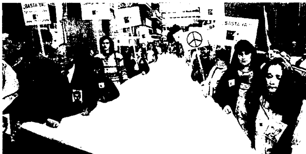
L'exaltació de símbols de caire feixista entre joves posa de manifest la importància de recórrer a l'antropologia per conèixer a fons els perquès d'aquesta situació. Fotografia: joves en un acte d'exaltació neofeixista a Dresde (Alemanya).

plicació dels principis del document i en la seva traducció en polítiques concretes.