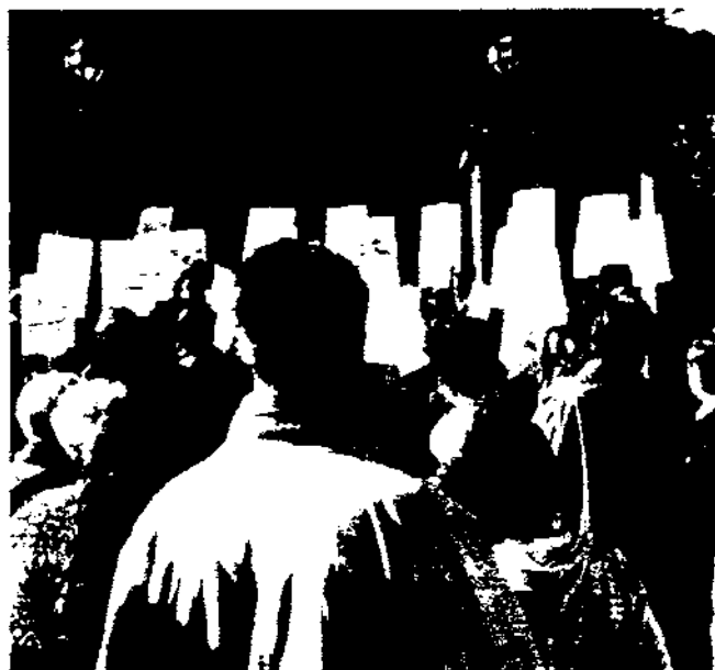
Veïns reivindicant nous espais per a activitats i serveis socials a Can Fargas (Barcelona, gener de 2001).

1999, Maza 2000). Aquí analitzem les actuacions de la ciutat i de les seves classes dominants com un moviment social d'interès antropològic per comprendre més la complexitat de la formació d'una Barcelona nova. Comencem amb una discussió de les arrels de la planificació moderna i continuem amb una anàlisi cultural dels discursos i dels espais del barri contemporanis. Amb aquestes dades, podem il·lustrar una dialèctica contínua entre imatge i resposta, burgesia i marginalitat, ciutat i barri, passat i futur.