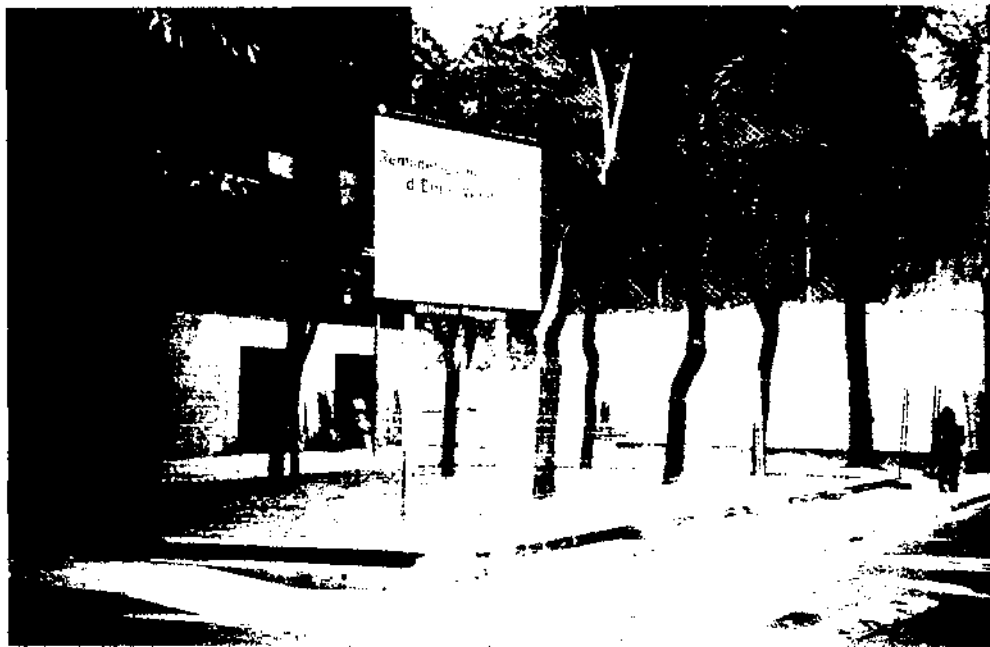
La plaça d'Emili Vendrell restaurada i oberta al públic: nous espais per a la convivència.

que han adoptat les rampes del Museu i la superfície de la plaça com a pista de patinatge.