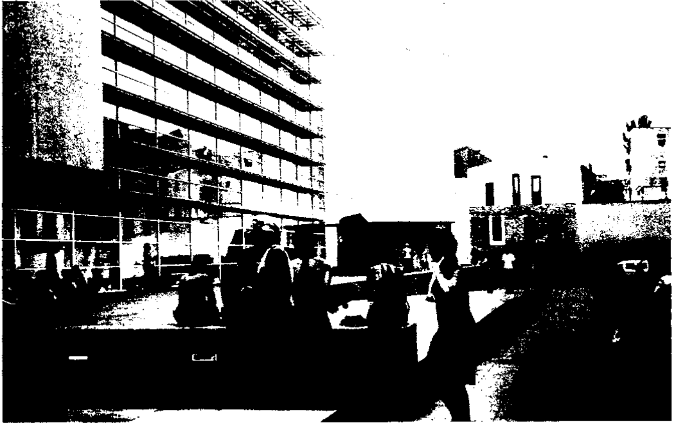
La plaça del MACBA: diversitat d'estils de vida i de formes de concebre la realitat.

que el temple va quedar mig tapat i gens realçat.