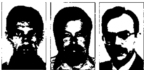
Gaspar Maza. Ajuntament de Barcelona Gary McDonogh. Bryn Mawr College. EUA Joan J. Pujadas. Universitat Rovira i Virgili

Les imatges socials sobre el barri del Raval tenen una càrrega estereotipada molt forta, que tendeix a reproduir-se al llarg del temps. Partim de la hipòtesi que, des de temps del Pla Cerdà, les polítiques socioculturals i urbanístiques públiques han adoptat la forma d'un contramoviment social que, amb la disculpa de lluitar contra la marginació social i la degradació urbanística, han posat l'èmfasi en mesures de control que volien suplantar o tutelar les iniciatives associatives sorgides de la gent del barri.