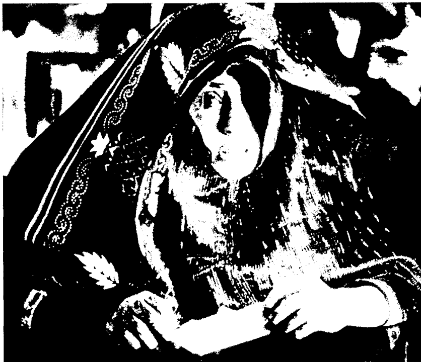
Un noia musulmana.

La problemàtica de la desestructuració social per motiu dels canvis és tractada per Ibn Khaldoun al se-