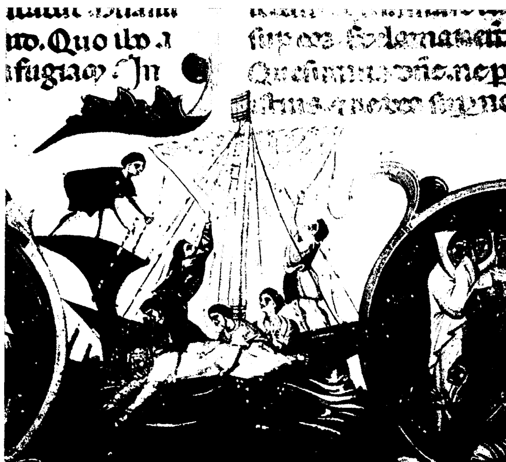
Pescadors i tempesta a la Mediterrània. Miniatura de la Bíblia de Dalmau de Mur (segle XII). Museu de la Catedral de Girona.

tir dels anys vuitanta, valors diferents dels que predominaven deu anys enrere. Es valoritza el treball, l'interès pels grans problemes socials, i es tenen en compte tant l'interès com els perills que pot comportar el progrés científic i tècnic. Els danesos, a la inversa, es mostren avui dia menys propers a l'acumulació de riqueses; desitgen reduir el temps de treball, critiquen el progrés de la ciència i de la tècnica i valoren més la societat de l'oci.