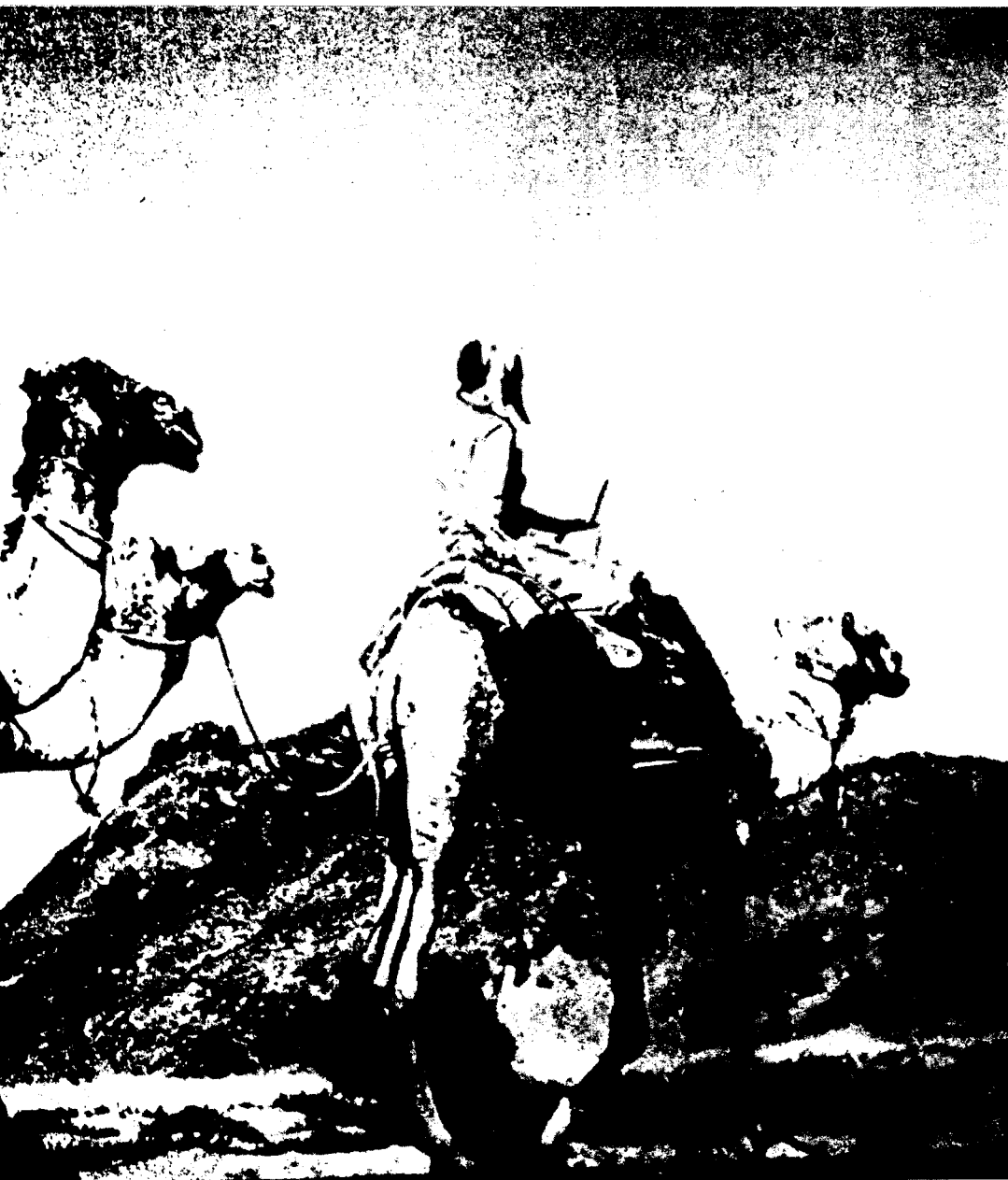
Beduïns al desert.

nòmic, sinó que els intercanvis entre els homes estaven valoritzats en referència a aquests interessos. En les societats pre-colonials magribines el treball constituïa un valor per se , sense recórrer, com en les societats capitalistes occidentals, al valor econòmic del temps. Amb la colonització, però, es va fer palesa una forta tendència a sobrevalorar les activitats que procuraven una remuneració monetària, com, per exemple, el treball assalariat.