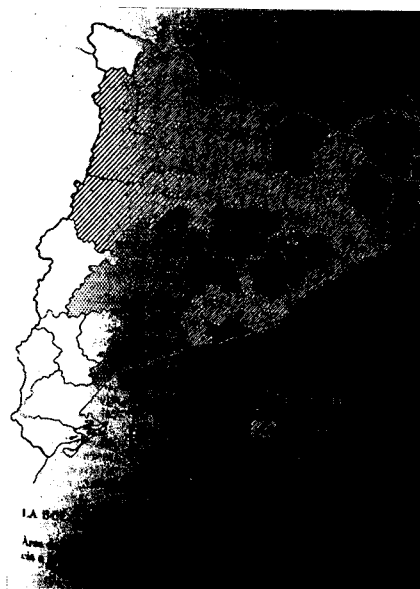
La bolangera. Àrea de distribució espacial. Les dues sagetes dobles al nord del país fan referència a les possibles vies de penetració de les influències franceses.