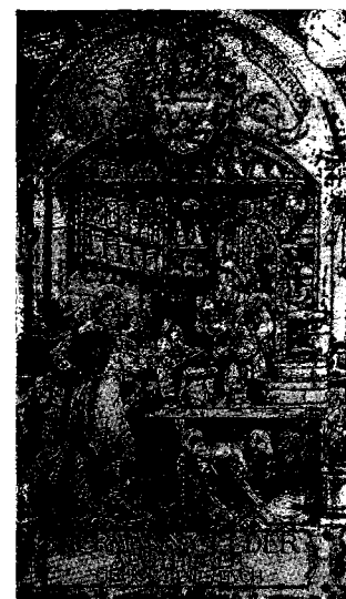
Despatx d'apotecari medieval.