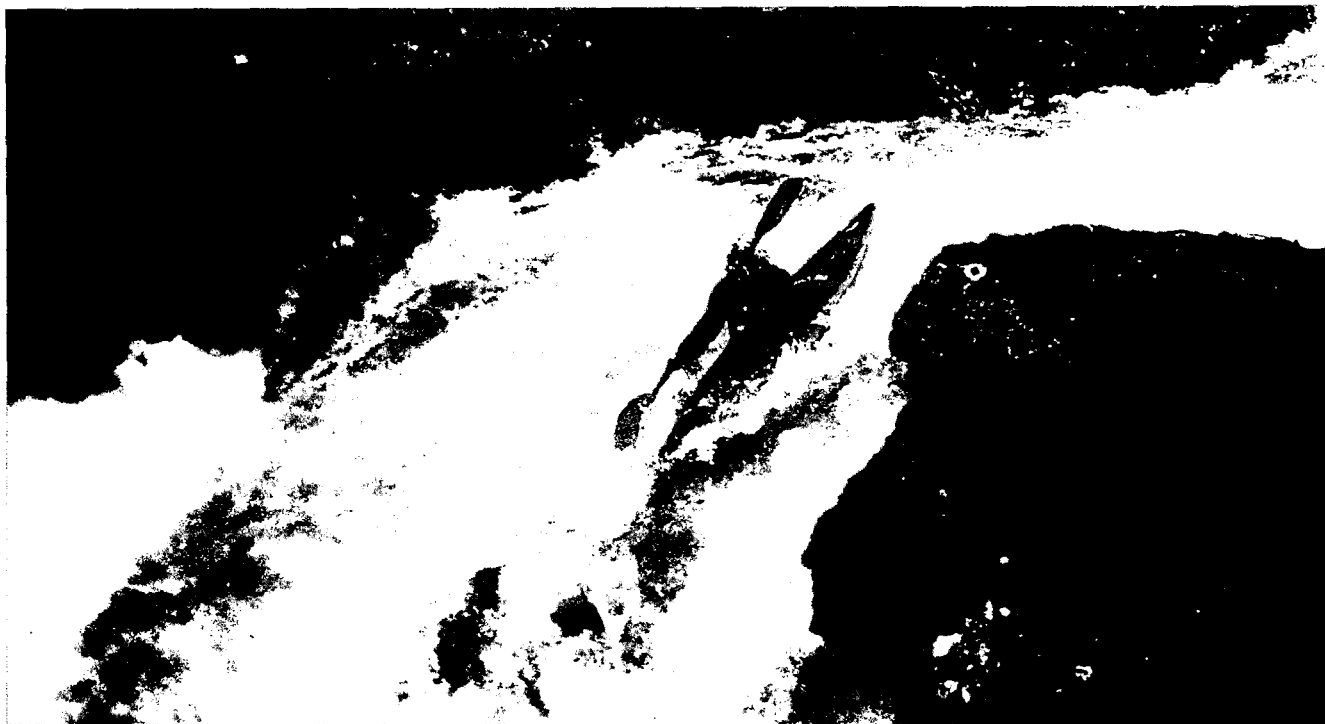
Velocitat i incertesa: l'emoció de la baixada. Piragüisme.

d'activitats), ajudant a la reactivació econòmica comarcal 22 i d'alguns sectors empresarials en crisi. 23