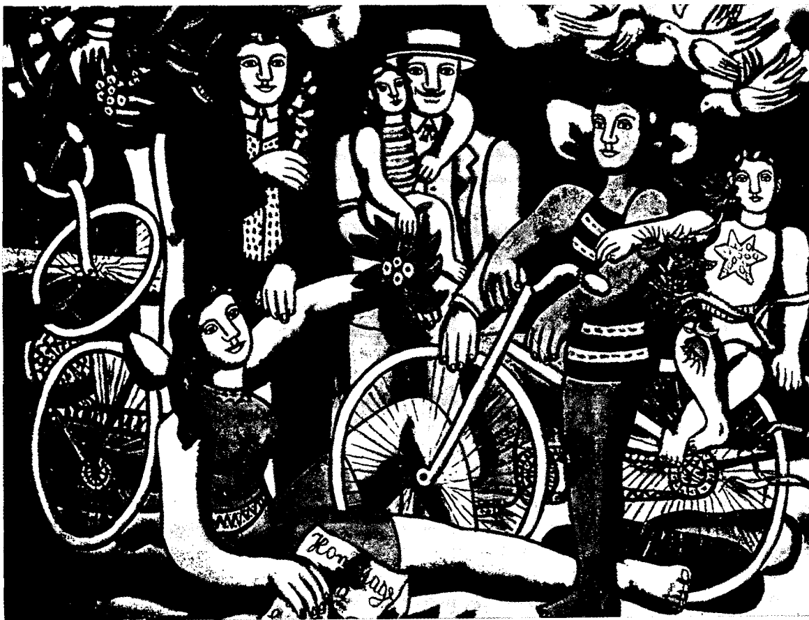
Fernand LÉGER. L'oci (Museu d'Art Modern, París, 1948).

mitjans de comunicació de masses. Amb la consolidació del periodisme especialitzat en esport, que ja era emergent des de la primera dècada del segle 3 i l'aparició de noves modalitats de gran difusió com l'humorisme esportiu, l'esport visqué un impuls formidable com a espectacle.