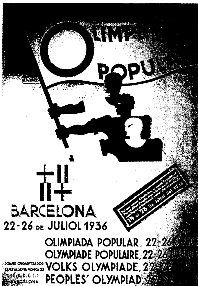
Cartell de l'Olimpiada Popular (1936).

gran bé. I en aquest sentit hem d'endegar-lo, entre tots, i aportar cadascú el seu esforç, petit o gran. Hem de voler que els nostres fills estimin l'esport, perquè és cosa sana, que tonifica l'esperit, que enforteix el cos, que forma els homes de demà. No hem de permetre, però, que esdevingui una obsessió, que enteli llur enteniment i que els faci esdevenir homes apassionats, sense criteri, idiotitzats per aquesta follia (...) gent que es diuen esportius, que són esportius i que no volen ésser més que esportius. Saben molt bé com s'enforteix el cos, com s'adquireix agilitat, com s'aconsegueix batre un rècord, però si no saben res més que això, si no els preocupen altres activitats, llur tasca és incompleta i a més improductiva. Per a la lluita diària de la vida és molt necessària la fortalesa del cos. L'home que només compta amb això, però, no pot aspirar a altra cosa que a esdevenir un perfecte descarregador del moll». 27