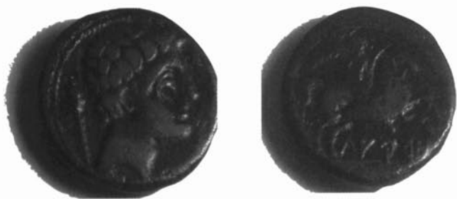
Adalt: moneda Lauro del Museu de Granollers.

Abaix: diners menuts de la primera meitat del s. XVII.