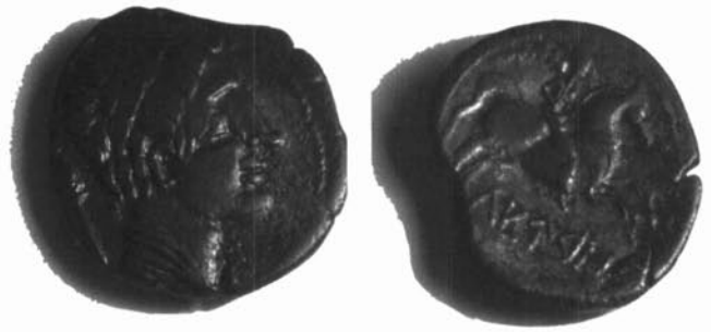
Monedes Lauro del Museu de Granollers. Adalt: procedent de Cànoves, donació d'E. ramón. Abaix: donació de M. Llorens i P. Pau Ripollès.

Un breu resum del contingut d'aquest tresor i les circumstàncies de la seva descoberta ens servirà per valorar-ne la importància i la relació que té amb la localització de la Lauro monetar. L'any 1959, es va trobar un petit conjunt de monedes a les proximitats del molí d'en Ribes, a un quilòmetre de Cànoves, quan uns treballadors netejaven la malesa d'un bosc. El dipòsit monetari, descobert sota unes pedres, estava compost per quaranta-una monedes de bronze que formaven una certa alineació. Aquesta circumstància va ser interpretada per Estrada i Villaronga com que havien estat contingudes en una bossa. Aquesta troballa estava composta per: una unitat de Laeisken (CNH, p. núm. 5), una unitat de Illuro (CNH, p. núm. 8), vint-i-una unitats de Lauro (CNH, p. núm. 11, 7, 14 i 17) i una meitat de la mateixa seca (CNH, p. núm. 8), dues unitats d' Ausesken (CNH, p. núm. 8 i 11), quatre unitats d' Eusti (CNH, p. núm. 5, 10 i 11), una unitat d' Eustibaikula (CNH, p. núm. 13), dues unitats (CNH, p. núm. 1) i una meitat (CNH, p. núm. 10) d' Illirkesken . Les monedes de Lauro constituïen,