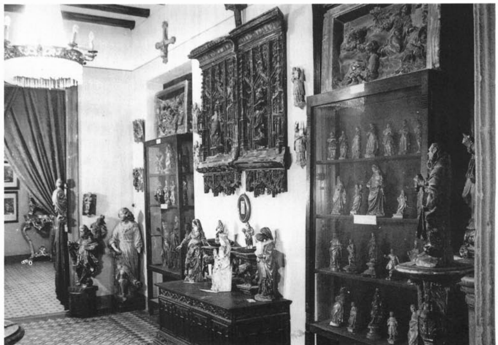
Una de les sales del Museu, a l'antiga casa Molina.

Vergós que van servir de guia per als vitralls policroms que es poden veure a l'església. També s'hi fa palesa la satisfacció per la creació d'un centre d'estudis, el novembre de 1952. El primer acte