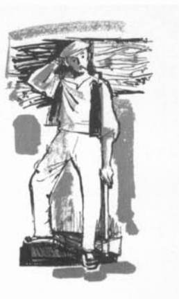
Les figures de pessebre de l'Ametlla del Vallès , fou publicada l'any 1960 amb il·lustracions d'Amador Garrell i Soto.