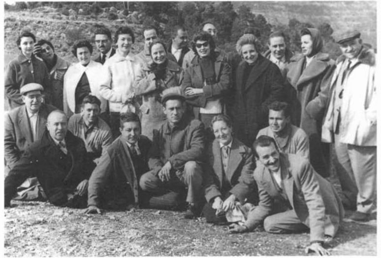
Excursió a Puiggraciós, febrer de 1958.

teix, o gregerías , si ho volen. Altres contes, com «El cabriolé estimbat» o «Miquelet», ens mostren un Sindreu ben agosarat en les imatges i en els continguts.