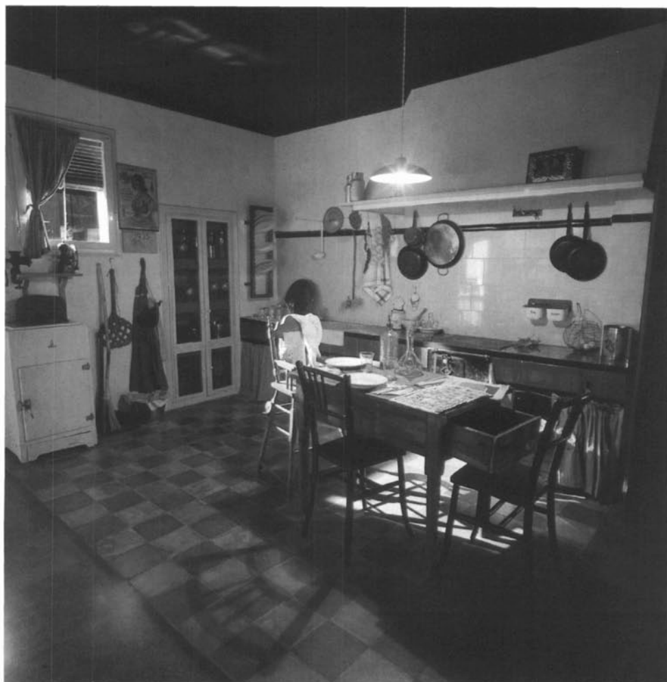
Interior del MHC.