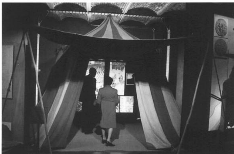
Interior del MHC. Tenda de Jaume I.

simbòlica o evocadora. Cal tenir present que aquests espais s'han resolt amb grans limitacions d'alçada i d'escassetat d'espai.