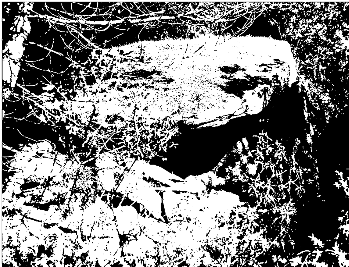
Dolmen de Sant Miquel de Conyelles

de 2 lloses laterals, 1 de capçalera i la cobertera. A la part anterior presenta restes de parets seca, si bé sembla que ha estat fruit de recondicions més moderns. Es desconeix l'existència de restes arqueològiques.