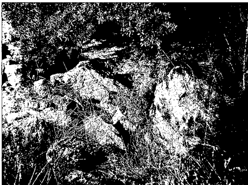
Casanova de can Serra

La localització en aquell indret també podria fer-nos pensar que han estat transportades des d'un altre