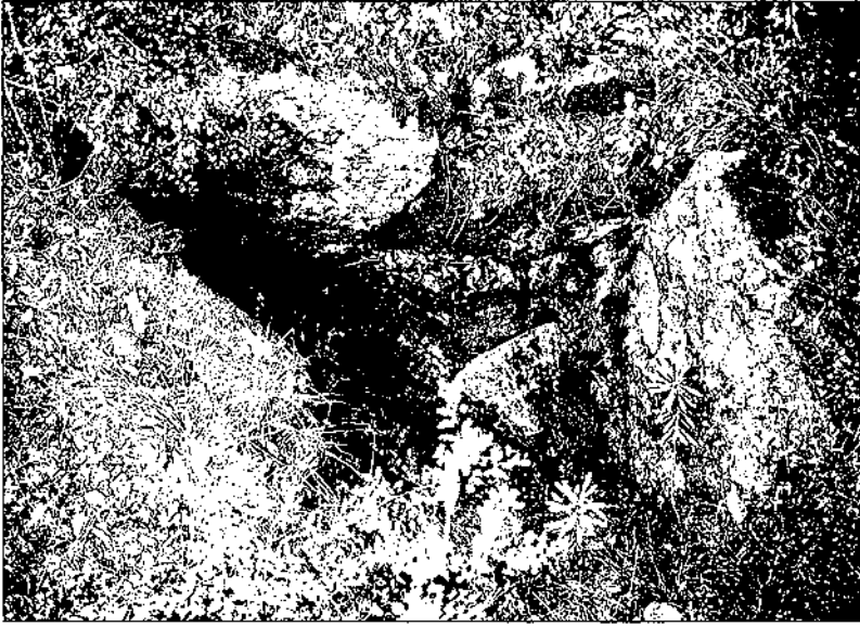
Dolmen Creu de Porròquia

grafia tradicional, apareix identificada com a cista tancada. Formada per quatre grans lloses, dues d'elles caigudes sobre el túmul circular, el qual ocupava un espai de 7 m de diàmetre. Les restes aparegudes constaven d'alguns fragments ossis, 7 dents i diversos fragments de ceràmiques informes. L'escassetat de restes fou atribuïda a la seva utilització com a refugi de pastors. Amb posterioritat l'estructura original va estar modificada pel propietari de la finca. En la reexcavació efectuada per Batista (1963) no hi va aperèixer res.