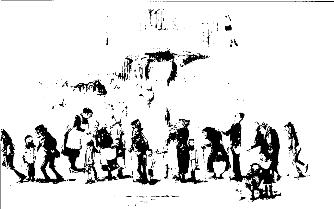
Capitales, dibuix d'Amador Gorrell. (Propietat del senyor Albert Murtra. Foto: F. Comas)