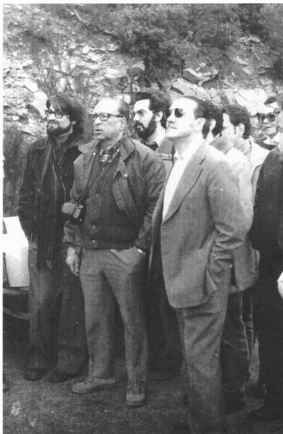
Excursió al Montseny amb els professors del Departament de Geografia de la UB, 1980.