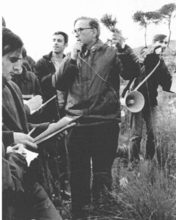
Excursió de pràctiques al Garraf, març de 1968.