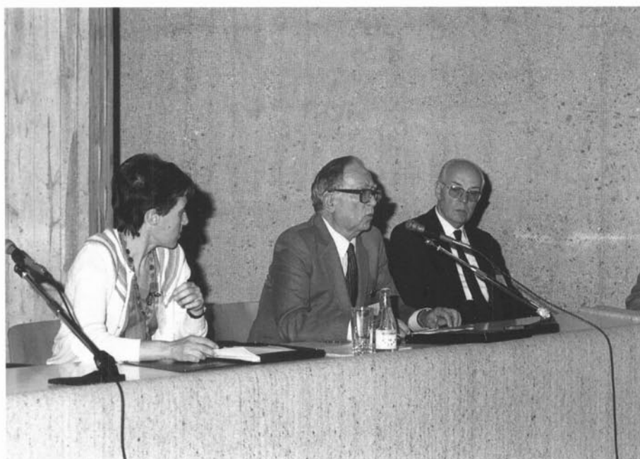
XXXIII Assemblea Intercomarcal d'Estudiosos al Museu de Granollers, els dies 17 i 18 d'octubre de 1987.

Geni i figura, Salvador Llobet morí treballant i abandonà la universitat sense acceptar l'homenatge que aquesta institució li oferia. Auster, fins i tot en els elogis, ens ha deixat una obra sòlida i àmplia que caldria aprofundir encara més.