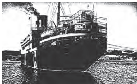
El vaixell hospital