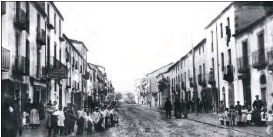
Aspecte que oferia el començament de la carretera, amb la farmàcia en segon terme, cap a 1910.