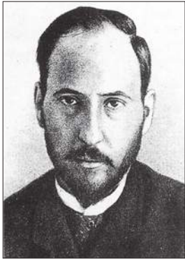
Santiago Ramón y Cajal