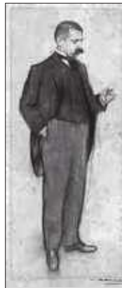
Manuel Duran i Ventosa, en retrat de Ramon Casas