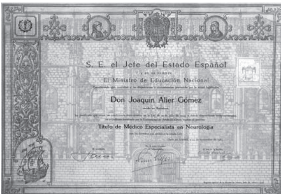
Títol de metge especialista en neurología