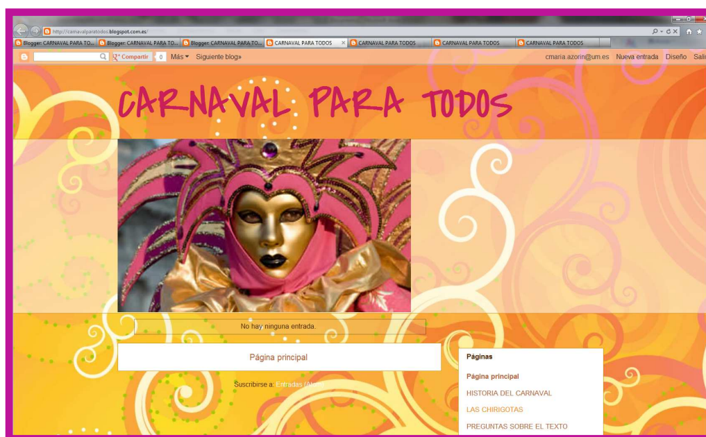
Figura 1. Captura del edublog "Carnaval para todos"