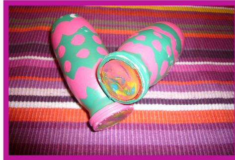
Figura 2. Maracas caseras realizadas por la alumna ganadora del concurso