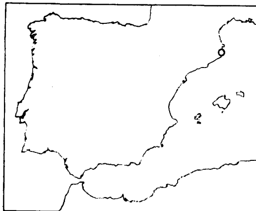
Fig. 1: Situació geogràfica del Baix Empordà. Geographical situation of Baix Empordà.