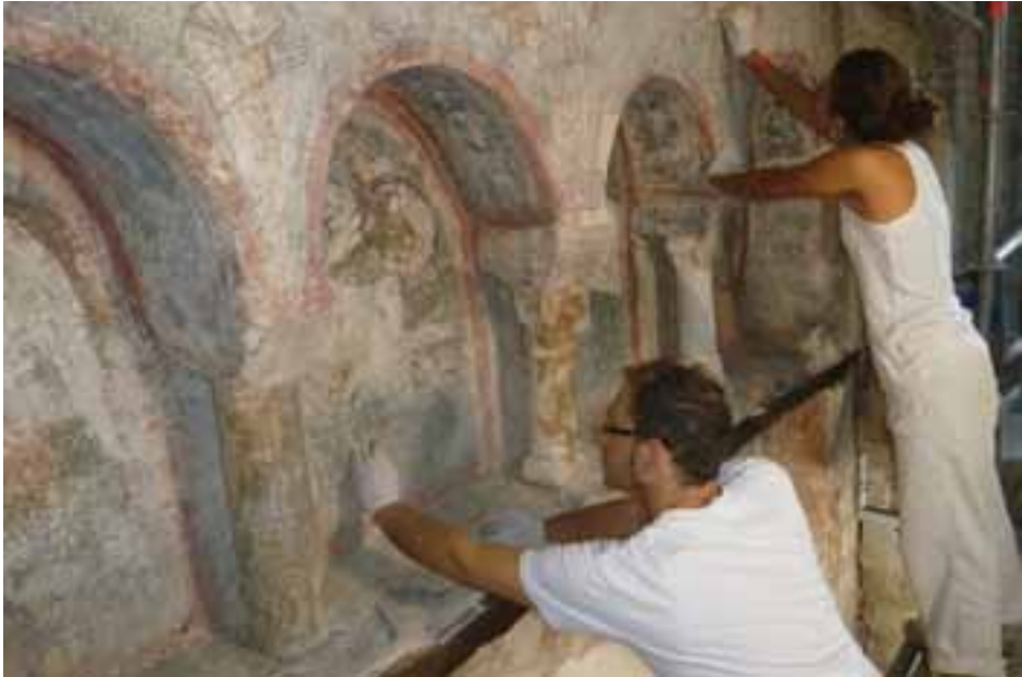
Figura 1. Treballs de restauració del retaule petri de Sant Pere.

concrets dels nostres jaciments, sobretot el material procedent de les excavacions de les esglésies de Sant Pere: epigrafia ibèrica, àmfores romanes, arquitectura cristiana, etc. Però també s'ha de fer esment de l'interès per estudiar aquells materials que són a d'altres poblacions i que procedeixen d'intervencions antigues, del segle XIX, com ara les sitges de can Bosc de Basea o els materials de can Missert. És per això que volem incloure aquí una petita aportació d'aquests estudis monogràfics redactats pels propis investigadors que, malgrat que siguin una mínima aportació de dades, els considerem importants per al nostre coneixement local. A tots ells, gràcies. En Jordi Pérez té l'honor d'engegar aquesta aportació puntual amb un estudi novell com és la presència, fins ara desconeguda, a can Missert d'una tomba d'època Neolítica, de la Cultura dels Sepulcres de Fossa, amb una datació entorn del tercer mil·lenni.