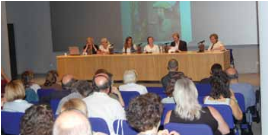
Jornada "L'herbari Art Nouveau" a Terrassa. Juny 2010.

Del 3 al 6 de juny es van celebrar a Terrassa diferents activitats organitzades per la xarxa d'Art Nouveau Network: el 1r Laboratori històric, l'Assemblea general i la 1a Reunió plenària del nou projecte "L'Art nouveau i Ecologia".