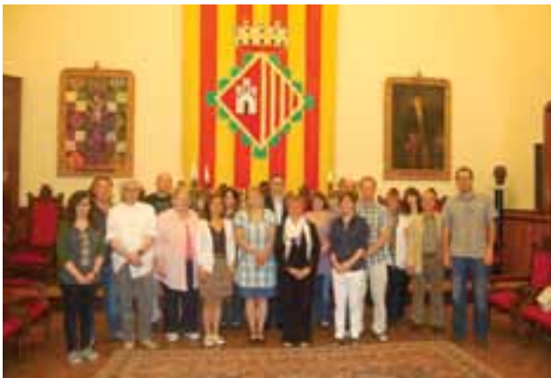
Visita de la delegació d'arxiviers suecs als arxius de Terrassa. Maig del 2011.