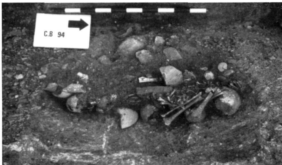
Figura 3. Els individus de Can Ballarà just abans de ser exhumats. S'aprecien els ossos a la fossa i també alguns esquelets amb els ossos tallats, ja que l'estructura va ser seccionada.

L'anàlisi antropològica ha consistit en la determinació del nombre d'individus recuperats amb l'estimació de l'edat i el gènere, seguint les directrius d'Olivier (1960), Ferembach et al. (1980), Masset (1982), Krogman i Iscan (1986), Brothwell (1987) i Alduc-Le Bagouse (1988). S'han estudiat altres característiques individuals, com ara la descripció dels caràcters no mètrics i el diagnòstic de les patologies òssies i dentals. També s'ha realitzat l'anàlisi mètrica dels elements ossis a partir de les dimensions utilitzades clàssicament en els estudis antropològics, que han permès contrastar la connexió proposada d'algunes parts de l'esquelet dels individus. L'anàlisi de tot aquest conjunt de dades té per objectiu conèixer la tipologia de la població, així com característiques del seu mode de vida. A més a més, l'estudi de la posició, les connexions i la preservació ha permès la reconstrucció del procés de deposició dels cadàvers a la fossa i aproximar-nos al moment de la seva mort i als rituals relacionats amb ella.