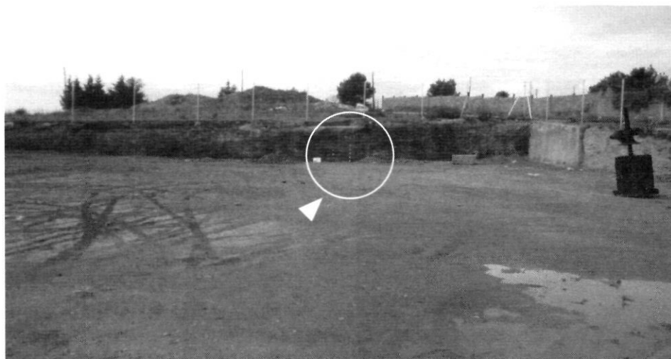
Figura 1. Emplaçament del jaciment de Can Ballarà, en el marc de les obres realitzades al Polígon Industrial Santa Margarida II per a la construcció d'una nau industrial.

El novembre del 1995, la revista TERME presentava els resultats de l'excavació de Can Ballarà (Carlús i Díaz, 1985), una sitja d'enterrament col·lectiu excavada al carrer d'Albert Einstein, s. n., del Polígon Industrial Santa Margarida II (fig. 1).