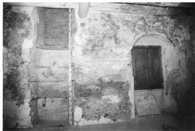
Carrer dels Gavatxons, 5, primer pis. Tram de muralla, façana exterior amb revestiment de pedres i còdols, disposats regularment i lligats amb morter de sorra i força calç.

La part oest (interior de la muralla) és construïda amb terra, de tàpia. Ambdues superfícies eren perfectament arrebossades, l'exterior amb morter de sorra i força calç, i la interior amb un fort gruix d'arrebossat d'argila sobre la superfície de tàpia. Aquesta part de la muralla presenta un gruix que va disminuint, pel costat oest, fins als 50 cm de gruix, amb la façana exterior totalment vertical.