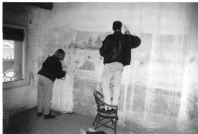
Carrer dels Gavatxons, 5, segon pis. Dibuix a llapis de Claudi Font, que reproduceix el port de Barcelona a mitjan segle passat.