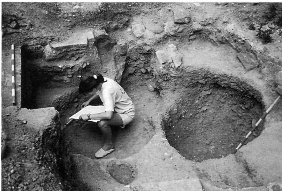
Carrer de Jaume Cantarer, núm. 4. Treballs d'excavació de les sitges de l'alta edat mitjana.

El material ceràmic recuperat als nivells de colmatació de les dues sitges esmentades ha permès observar una seqüència cronològica des de l'època ibèrica (segle II aC), època romana (segles I-II dC), època tardana (segles V-VI), i alta edat mitjana (segles XI-XII). Aquest ampli ventall cronològic confirma les conclusions que ja apuntàvem a l'excavació de la plaça Vella: 6 que l'entorn de l'actual torre del Palau ha estat ocupat ja des de l'època ibèrica i la