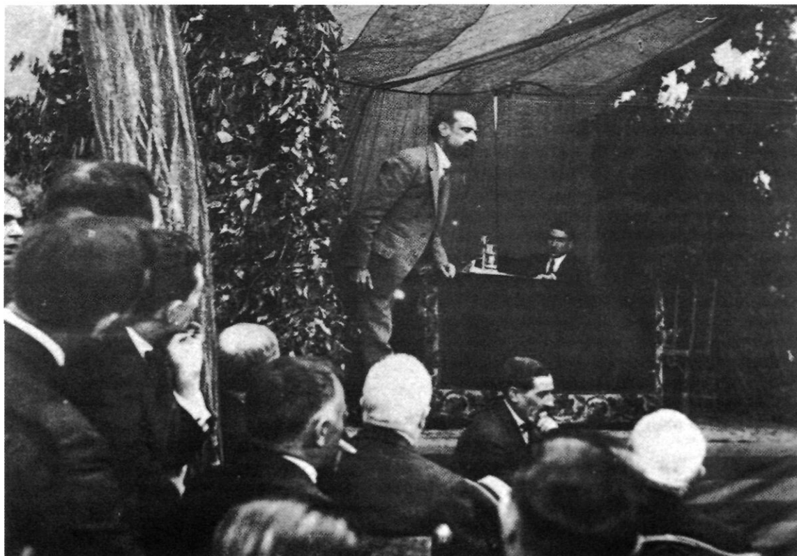
Francesc Cambó a l'Associació Nacionalista de Terrassa, el 1920.

A Terrassa, el 25 de desembre de 1891, seguint una tradició política local molt arrelada, es creà un nou cafè-polític en els baixos de l'Institut Industrial, anomenat Cafè Català i que aviat es va convertir en la nova seu de l'agrupació regionalista.