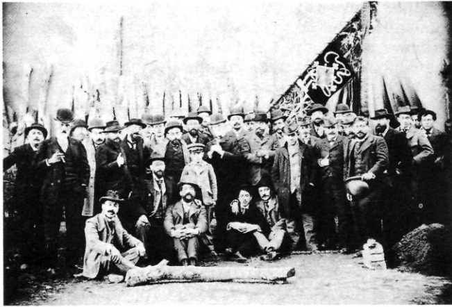
Fundadors de la coral de l'Agrupació Regionalista de Terrassa, després del 1907.