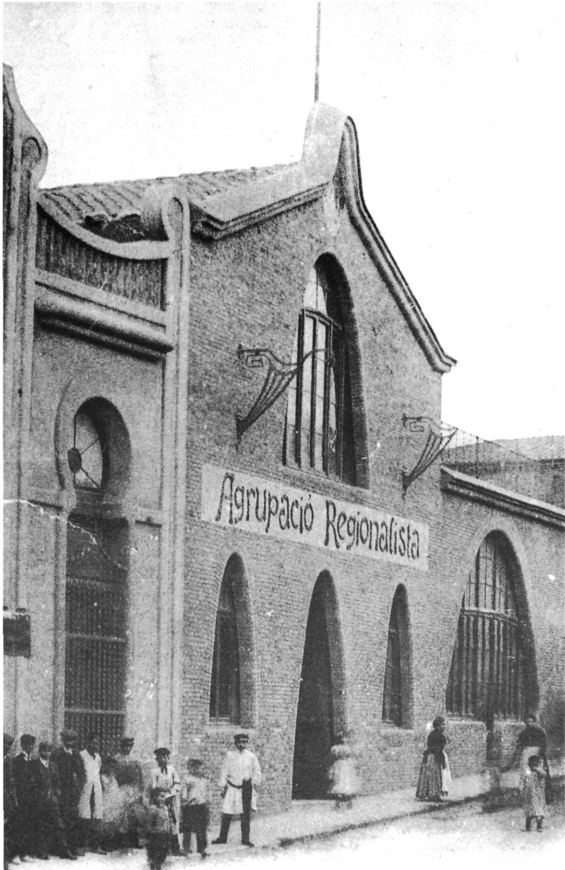
Seu de l'Agrupació a la Plaça Mn. Cinto Verdaguer.