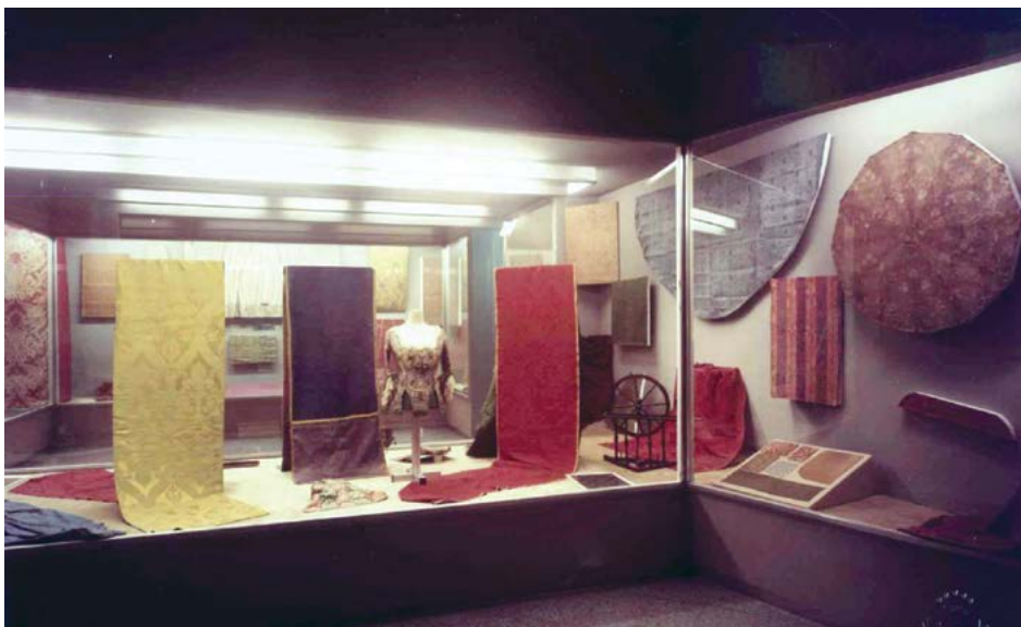
Sala de teixits al carrer Salmeron. 1971

No és, com ja hem dit, fins pràcticament l'any 1987 que es va iniciar el registre i inventari sistemàtic de les col·leccions del CDMT. Tot i així, any rere any, col·lecció