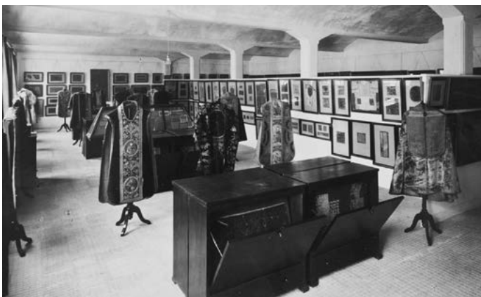
Primera seu del Museo Textil Biosca al carrer Sant Isidre.