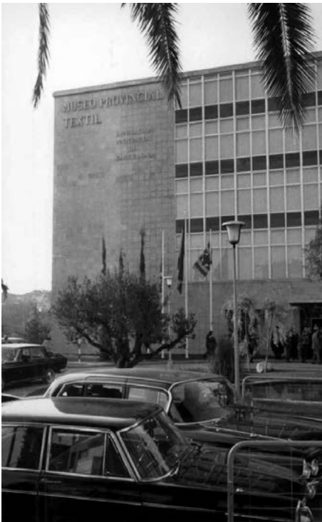
Nova seu del Museo Provincial Textil al carrer Salmeron. 1971

número que els corresponia i ara, davant del dubte, consten com a "fons antic" ja que són similars a les de la col·lecció Tolosa. Tot i així, gràcies un cop més a les fotografies, en aquest cas dels catàlegs de la Sala Parés i Galeria del Cisne 34 , hem pogut localitzar-ne algunes. Cal tenir en compte, a més, que alguns números de registre poden correspondre a dues o més peces, com un conjunt de jupa i casaca. Això fa que el nombre de peces en realitat augmenti, i que el total sigui superior al dels números registrats. Excepte sis números donats de nou, la resta mantenen la numeració que els correspon segons el llibre de registre.