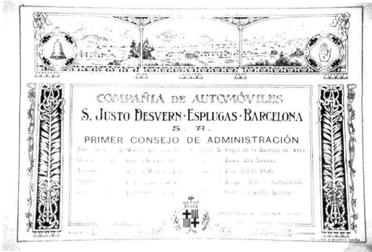
Primer Consell d'Administració de la Companyia d'Automòbils. (Original Juli Ochoa).