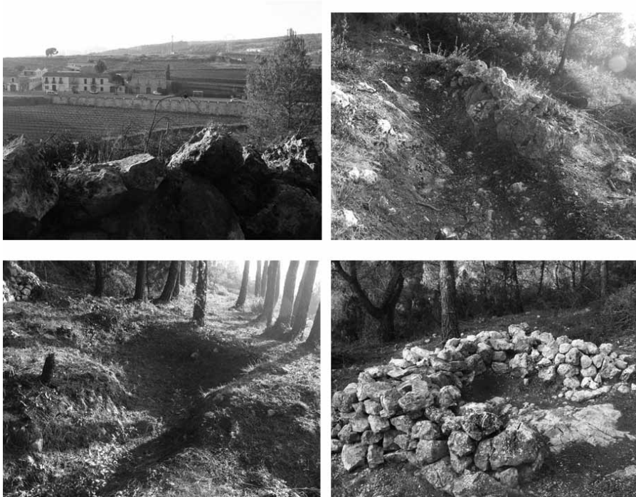
Figura 12: Fotografies cedides per Oriol Miro Serra que mostren diferents perspectives i estructures de la batalla de l'Ordal.

ha estat totalment saquejada, sovint sense consciència de les greus conseqüències que es deriven d'actuar sense metodologia científica. Això ens deixa un buit d'informació considerable perquè en ser unes estructures tan improvisades no es pot interpretar de forma correcta el desenvolupament d'una batalla que, encara que de poc abast temporal, té un notable impacte per al final de la GCE. D'aquesta manera, què convé examinar a l'hora de valorar el perquè del continu espoli del patrimoni arqueològic del conflicte de 1936-1939? És evident que entre les causes que expliquen la "perillosa política de desaparició" que pateixen aquestes restes (González Ruibal 2007) subjeu, com hem avançat, el poc valor com a objecte científic que tenen les estructures