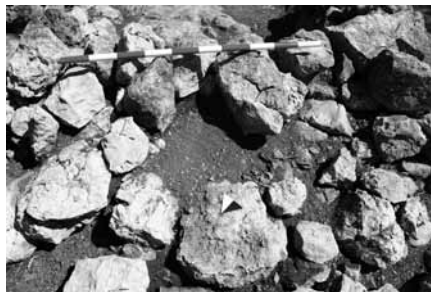
Figura 11: Detall de la UE 2004 composta per sediments gravosos molt compactats que indiquen la presència de sacs terrers.

El 23 de desembre de 1938, amb les primeres canonades al front de Serós, s'inicià l'anomenada Campanya de Catalunya que va cloure el 13 de febrer de 1939, quan el darrer refugià passà la frontera francesa. Les tropes franquistes iniciaren l'ofensiva