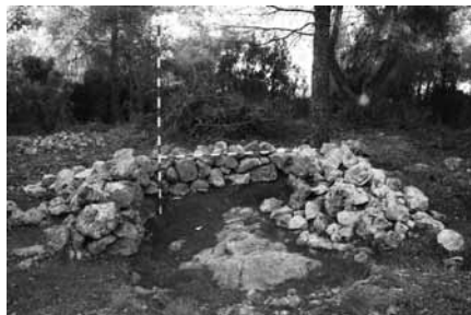
Figura 10: Vista del niu de metralladora des del S.

Unitat estratigràfica 2002. Mur realitzant amb pedra seca, en un estat de conservació òptim. En alguns punts està cobert per 2004,