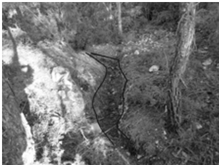
Figura 1: Tram de trinxera conservat a la zona del Portatge (dit Pago), Subirats (Alt Penedès, Barcelona).

2005), com és, en el cas que ens ocupa, la Guerra Civil espanyola (1936-1939) (a partir d'ara GCE). En aquest cas, ens interessava, a més, mostrar un exemple de la diversitat dels espais de conflicte que configuren els escenaris de la guerra de 1936-1939 que varien segons els combats, les campanyes i els fets condicionants que imposa la dinàmica de la mateixa guerra (Alonso, 2008: 296-297). Subirats és un bon exemple de la individualitat i particularitat de cada zona o context de la GCE; contràriament a la imatge d'imponents trinxeres que s'ha llegat a l'imaginari col·lectiu, les estructures defensives aquí conservades evidencien una ràpida construcció, tal com es mostra a la figura 1. A més, com més endavant ensenyarem, això ja pressuposa que una bona part, si no la totalitat, dels materials associats a aquestes estructures seran de caràcter bèl·lic, essent probablement gairebé absents els referents a la vida quotidiana, ja que en aquesta zona el front no es va estabilitzar durant mesos i mesos -com va ocórrer, per exemple, a Madrid en els primers mesos de la guerra- (González Ruibal et al. 2010), sinó que es va produir un avançament ràpid de l'exèrcit sublevat.