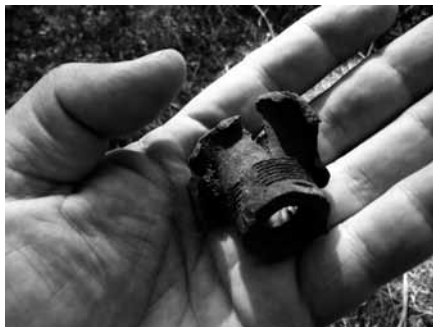
Figura 6: Fragment d'espoleta d'un d'artilleria localitzat en la intervenció arqueològica a El Pago, Subirats (Alt Penedès).

dels equips de prospecció 8 . Quan el detector assenyalava la presència d'un objecte metàl·lic aquest s'excavava i es guardava individualitzat, això és, en una petita bossa amb fitxa que incloïa les dades més rellevants de la peça (jaciment, GPS, dia, hora, waypoint designat per l'aparell, tipus d'objecte i altres informacions rellevants que es puguin determinar a camp) 9 .