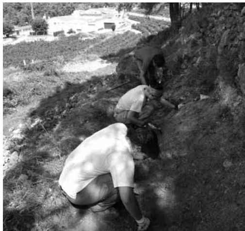
Figura 7: Excavació de la trinxera del sector 01 on s'aprecia la visió de la N-340 des d'aquesta. També es pot veure la UE 1002 (el mur de contenció del camí).

7; fig. 8). Documentarem també una altra trinxera així com un possible embut fruit d'un impacte de bomba. A continuació detallarem les unitats estratigràfiques documentades: