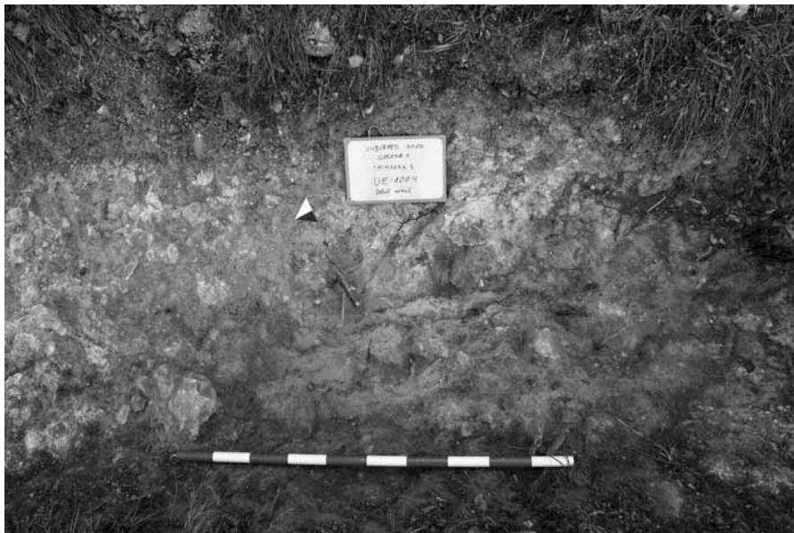
Figura 9: Detall de la UE 1004 on s'observa la coloració groga i rogenca, fruit segurament d'un procés de rubefacció tipus impacte de bomba.

de metralla trobades a la vora, tot i que no al mateix nivell. En contacte amb la UE 1001, el límits són força clars.