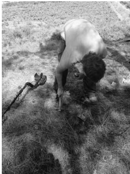
Figura 5: Arqueòleg del DidPatri equipat amb detector de metall i GPS prospectant el camp de batalla de l'Ordal.

L'equip va prospectar la zona del camp de batalla mitjançant detectors de metalls per tal de recollir materials metàl·lics que podien ser restes de metralla, bales, beines, etc (fig. 6). Cal dir, a més, que en el cas d'aquesta intervenció es va establir una prospecció de caràcter orgànic que és l'utilitzada en espais de conflicte quan l'orografia abrupte del terreny i altres impediments (la massa forestal en aquest cas) impedeixen establir transectes lineals i, d'aquesta manera, la inspecció es redueix només al treball de camp en el 100% d'àrees accessibles (Rubio Campillo, 2009b: 29). Quant al mètode de registre, aquest es basava en l'ús d'aparells GPS. Cada equip comptava amb un aparell per tal de georeferenciar de totes les troballes així com el recorregut