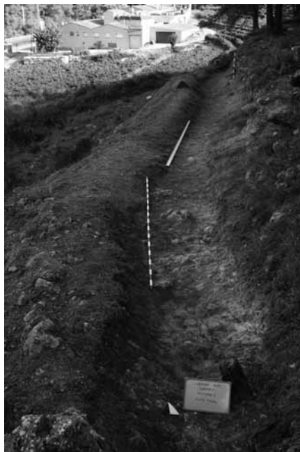
Figura 8: Vista de la trinxera des del S.

Unitat estratigràfica 1004. Nivell format per sorres, força compacte (fig. 9). Color groguenc i vermellós, resultat d'un procés de rubefacció del sediment, possiblement un impacte bomba com semblen indicar les restes