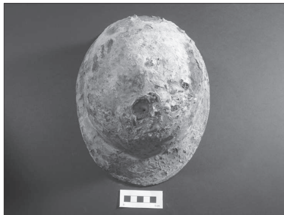
Figura 10. Casc model Adrian M-26.

Dins d'aquest punt cal destacar la troballa d'un casc francès model Adrian M-26 34 , localitzat al Camp d'aviació de l'Aranyó.