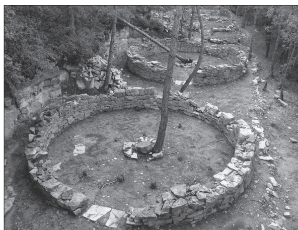
Figura 3. Conjunt de tendes còniques o del tipus suís documentades al campament militar de Pujalt.

Eren estructures circulars de 6,20 m de diàmetre, amb una base de pedra, d'altura aproximada d'1 m (per evitar l'entrada d'aigua a l'interior), amb una estructura circular al centre, de 1,10 m de diàmetre, on hi hauria un puntal de fusta que subjectava la lona que les cobria. Al voltant d'aquestes es van excavar un conjunt de canals per desviar l'aigua cap a terrasses inferiors.