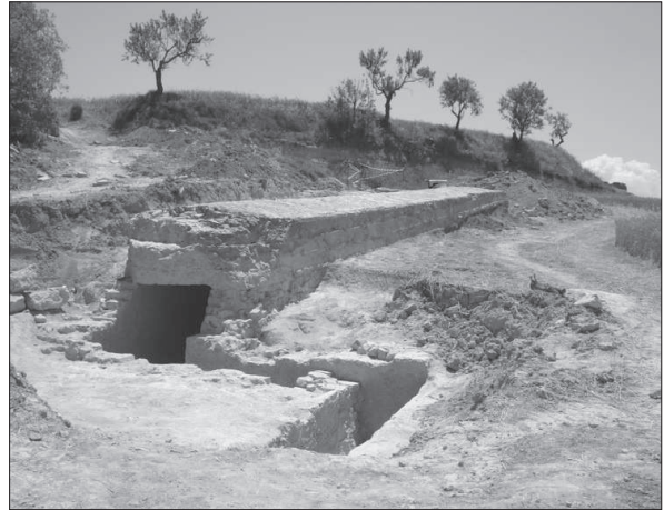
Figura 7. Refugi-trinxera (àmbit 2) del conjunt defensiu de la L-2, al pas de Vallbona de les Monges.

L'estructura té planta allargada, excepte a les boques d'accés on gira formant una petita galeria d'entrada a la galeria principal. Té unes mides de 23 m de llargada i una amplada interior d'1 m.