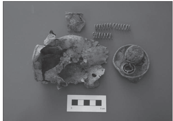
Figura 11. Restes d'una bomba de mà del tipus Lafitte .

De l'estudi de la munició recuperada s'extreu que mentre que dins del context republicà hi havia una gran varietat de fusells, dins del context nacional (Vilamur) s'ha trobat munició de tres tipus de fusells principals: el Mauser espanyol model 1893 de 7 x 57 mm de calibre; el carcano italià model 1891 de 6,5 x 52 mm de calibre i el famós Mauser k98 alemany calibre 7,92 x 54 mm de calibre.