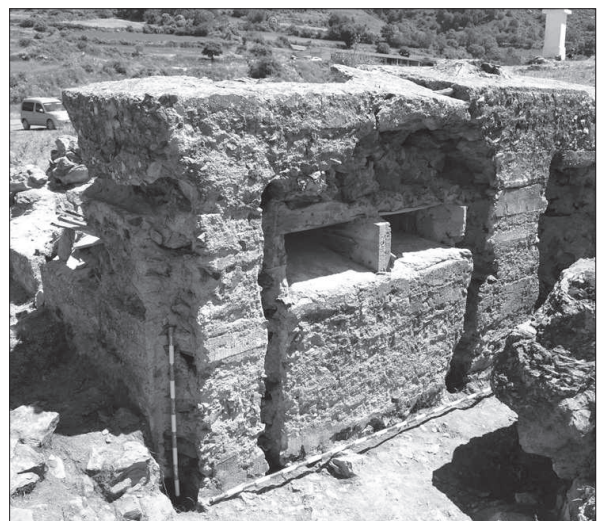
Figura 9. Casamata del conjunt defensiu de la Zona B, a Vilamur.

Entre els objectes quotidians i personals, s'han recuperat peces relacionades amb la higiene, com diferents fragments de miralls, una màquina d'afaitar, tubs de pasta dental i ampolles petites de colònies; objectes relacionats amb la correspondència dels soldats, entre els que destaquen la troballa de nombrosos tinters i alguna ploma estilogràfica; i alguna medicament (xarops) i revitalitzants –un d'ells de Cerebrino Mandri amb la llegenda " Cerebrino Mandri. Cura los dolores nerviosos y reumáticos "– i una caixa per posar