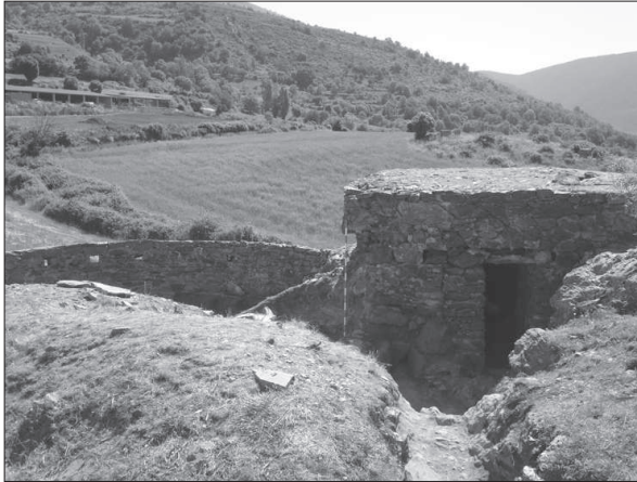
Figura 8. Conjunt defensiu de la Zona A, a Vilamur.